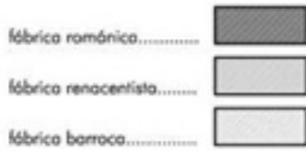
IGREXA PARROQUIAL DE VINCIOS (segundo a.s.t.)