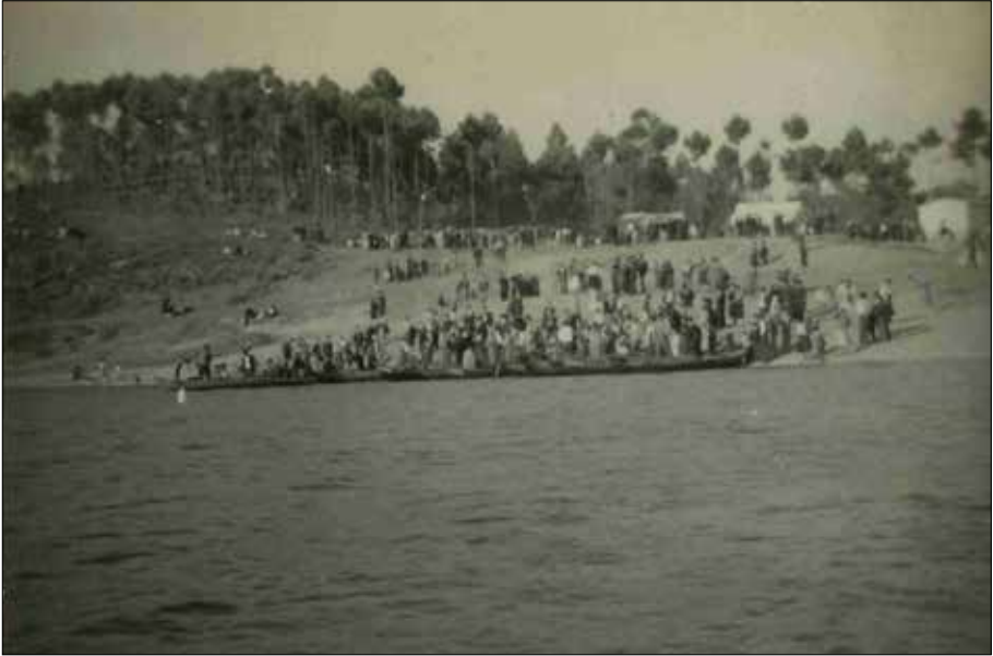
Lances de cruz entre Torrón e Cristelo Covo, ca 1950.