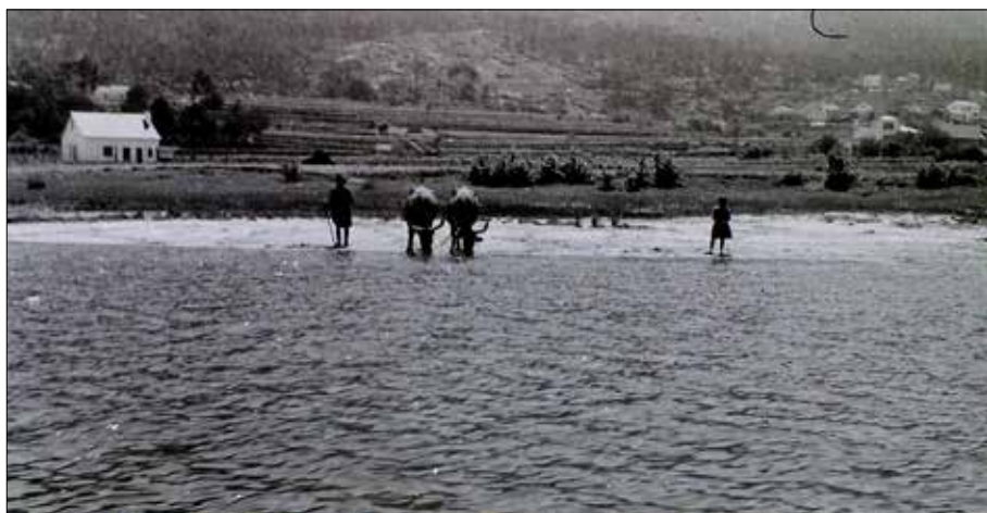
Muller e nena pastando bois na marxe portuguesa.

Esta situación foi ollada polas poboacións da outra marxe que foron quen de reactivar os lazos existentes e adaptarse ao clima de inestabilidade e perigo constante. Fronte ao efecto sorpresa das detencións, das coaccións, fortalecéronse as redes de fuxidos e do contrabando transfronteirizo.