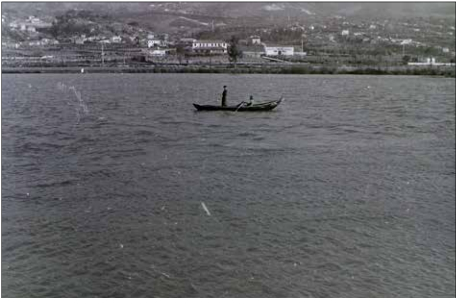
Barqueiros no río Miño.

A guerra da España prodúcese cando na outra marxe xa está instaurada a Ditadura de Salazar. Un ambiente que se recría na fronteira durante a última semana de xullo de 1936 coincidindo co exilio masivo dos milicianos que resistiran no sur das provincias de Pontevedra e Ourense. O goberno envía soldados á fronteira que se unen á Guarda Fiscal e á actuación da PVDE 12 aumentando de xeito considerable a presión sobre as poboacións raianas e incrementando o grado de hostilidade. O peche de fronteiras e a presenza da policía fiscal e política significa que o uso do río está fortemente condicionado. Polo tanto a pesca, o paso de persoas 13 e o contrabando se ven entorpecidos polas novas ordes ditadas dende Lisboa. En definitiva, as actividades económicas e sociais son alteradas e con elo a vida cotiá das persoas.