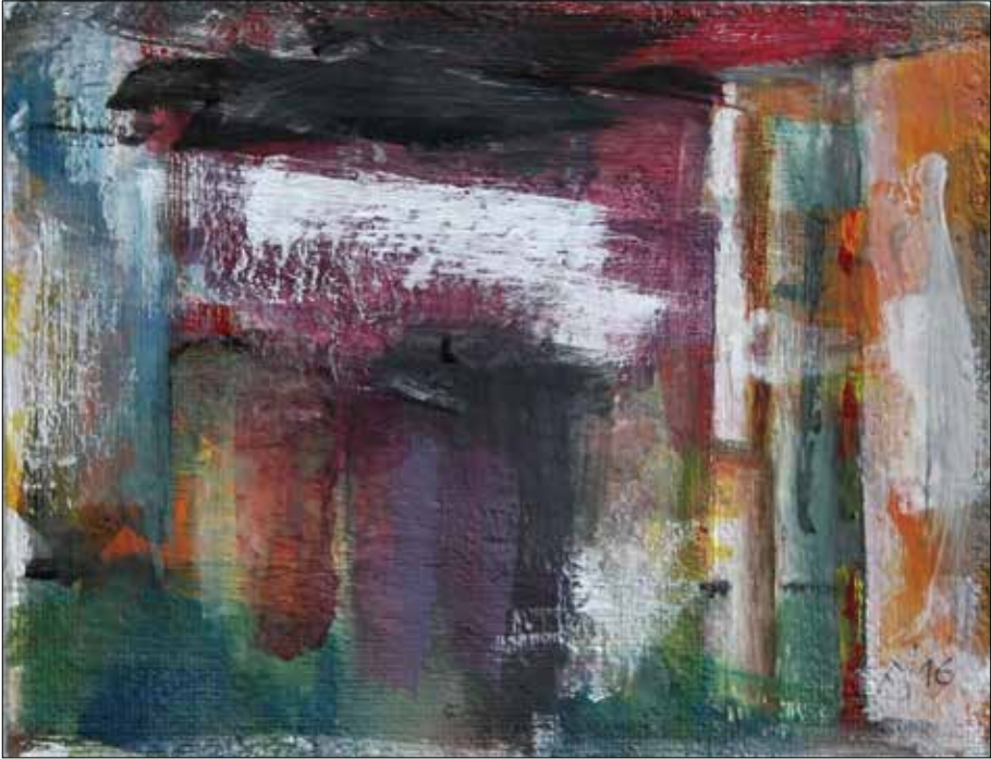
Patín. 2016. Acrílico. 21x27 cm.

Xunto ao catálogo de Joaquín Sorolla hai un prato con dous paquetes de galletas. Colle o que contén as de coco, ábreo, convidame, e tras o meu rexeitamento queda con tres. Mentres as come, fala. Pouco despois faise con outras dúas.