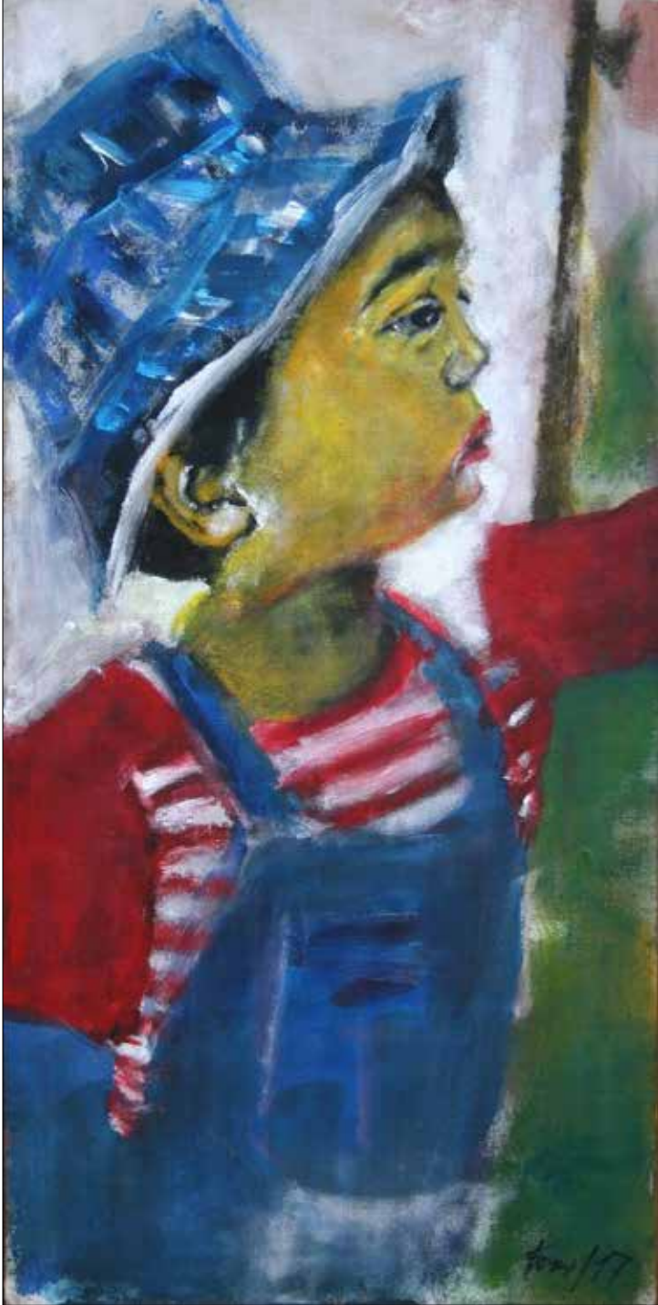
Lucas. 2017. Acrílico. 80x40 cm.