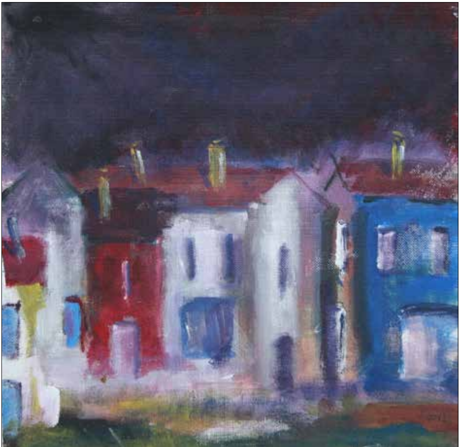
Casas do remo. 2017. Acrílico. 60x60 cm.

Ao erguerse agarra o lapis de memoria e entrégamo. Contén unha carpeta con fotografías seleccionadas de parte da súa obra escultórica e pictórica. Gárdoo nun peto