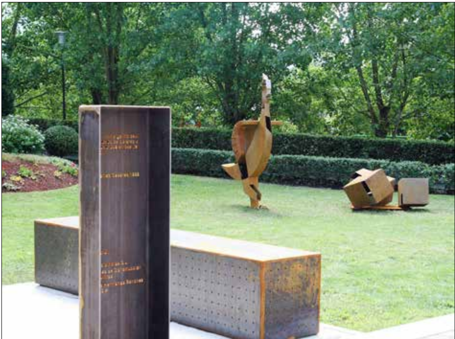
A galiña azul; un conto. 2004. Aceiro corten, inox., madeira e granito. Obra pública en Gondomar.