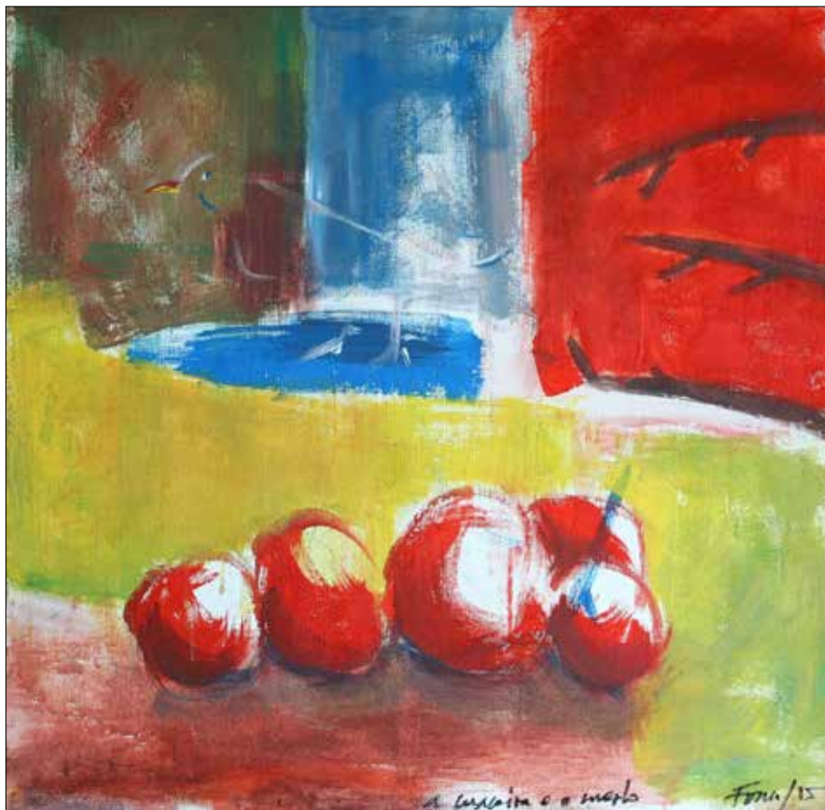
A maceira e o merlo -I-. 2015. Acrílico. 60x60 cm.

Mentres a medio petrificar pescudo coa vista, el xa colocou no reprodutor musical un CD de Leonard Cohen. As melódicas salmodias toman corpo e ao tempo que invaden toda a casa fan aflorar nun emocións durmidas.