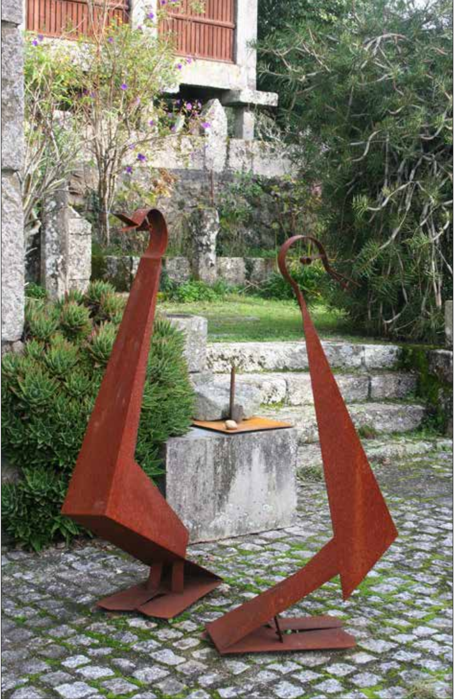
Parrulos. 2016. Aceiro corten. 159,00x110,00x115,00 cm.