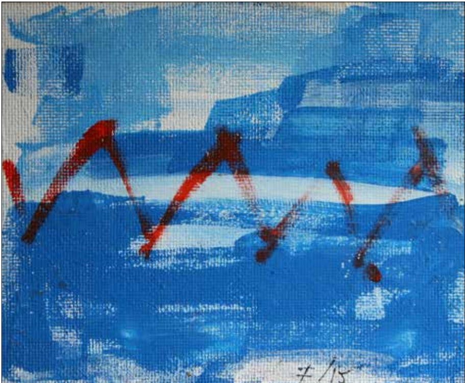
Porto industrial ao anoitecer. 2015. Acrílico. 24,50x30,00 cm.

Cita as ocasionais excursións xunto con outros compañeiros da Facultade á “Estrella”, mítica rúa de viños coruñesa onde estudantes, traballadores, señoritos, solteiras, burguesas, pais de familia, curas, militares, casadeiras, mariñeiros, librerías, xubilados e demais tropa se poñían cegos a base de ribeiro, cigales e cervexa en locais como O Priorato, La Bombilla, Os Tigres e moitos outros; unha auténtica restra onde elixir. O