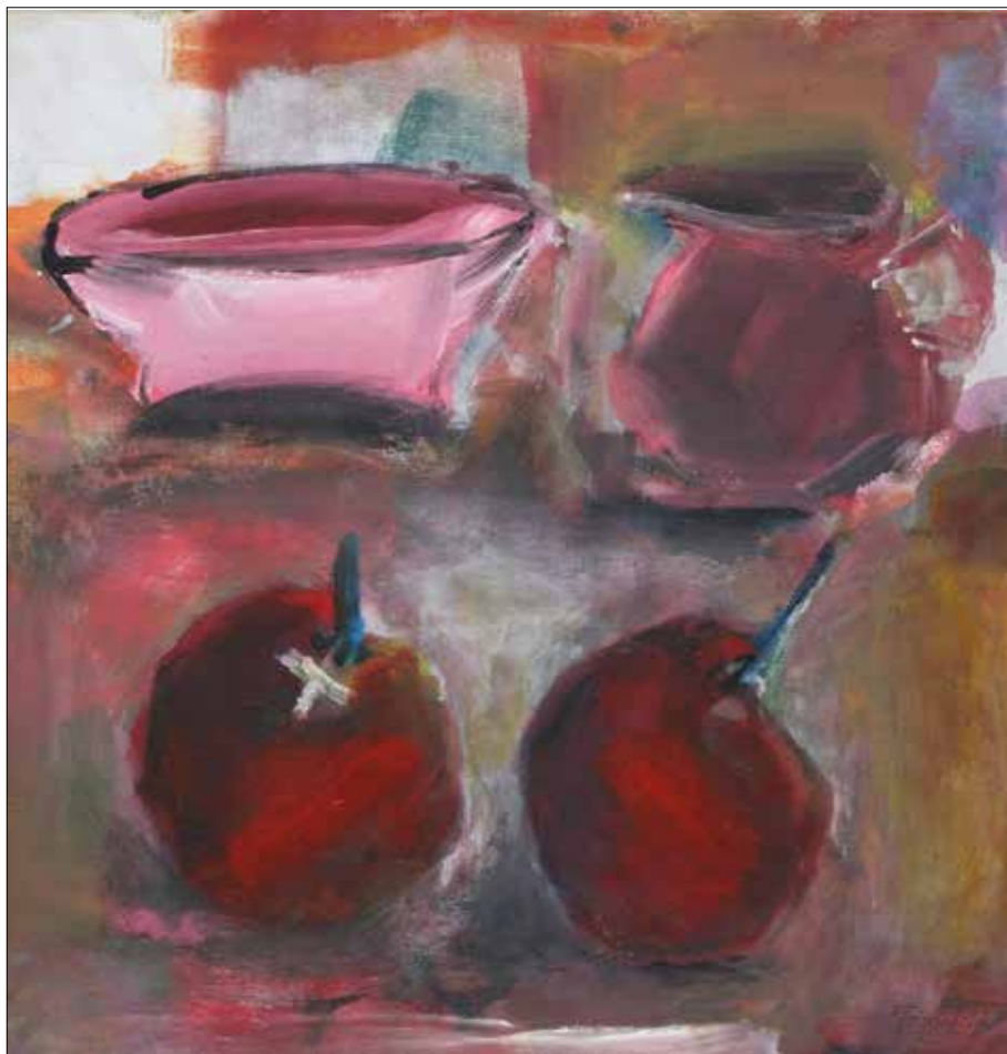
Canecos e froitas. 2017. Acrílico. 60x60 cm.

Xeralmente traballo por iniciativa propia pero recoñezo que a obra por encargo, a cal tiven ocasión de afrontar en moitas ocasións, introduce variables para min máis atractivas contrariamente ao defendido actualmente por un considerable número de escultores e pintores de ambos os dous sexos. As premisas de partida dun encargo enténdooas como unha oportunidade de resposta concreta á que estou disposto a someterme. É necesario facer unha análise contextual que me incentiva pola dificultade adicional que supón. Isto historicamente foi unha constante.