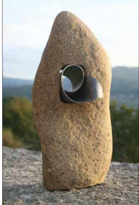
Maternidade. 2018. Granito e chumbo. 35,00x16,50x16,00 cm.

Por veces encara a obra escultórica coma se se tratase dunha arquitectura e é aí cando bota man de profesionais da súa confianza os cales coordina, supervisa e corrixe. Isto, que non é novo, recordemos por exemplo que case toda a obra escultórica de Le Corbusier, quen por certo se consideraba ante todo pintor, foi executada a distancia nun proceso de ida e volta polo ebanista e máis tarde escultor bretón Joseph Savina, ou que, máis acá no tempo, a de Álvaro Siza é levada a cabo polo taller de carpintaría portuense de José Simões, isto, dicía, dá indicios de cales son as prioridades artísticas tanto proxectuais como executivas do autor. Alfonso non decide o proceso e a implicación ou non de colaboradores en función do tamaño da obra; son outros os parámetros que determinan isto como demostra o feito de que gran parte da súa produción sexa de pequeno formato e iso non impedisé a participación ocasional de profesionais de distintos oficios. Tampouco desdeña as posibilidades ofrecidas polas novas tecnoloxías.