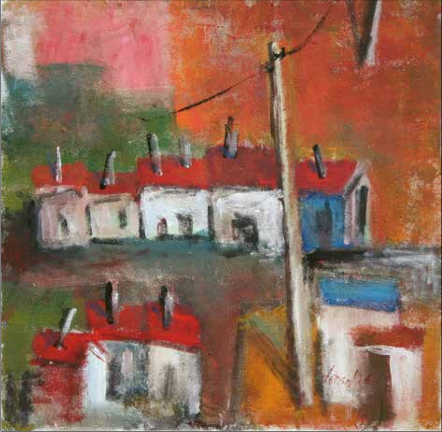
Tierra de Campos. 2016. Acrílico. 60x60 cm.

has enormes cerámicas da súa autoría e unha xeométrica butaca de madeira tamén súa antes de chegar á sala. En canto alcanza un sofá déixase caer; eu imítoo. Nos estantes libros e fotos, enriba da mesa un gran catálogo sobre a obra de Sorolla no que repousa un lapis de memoria.