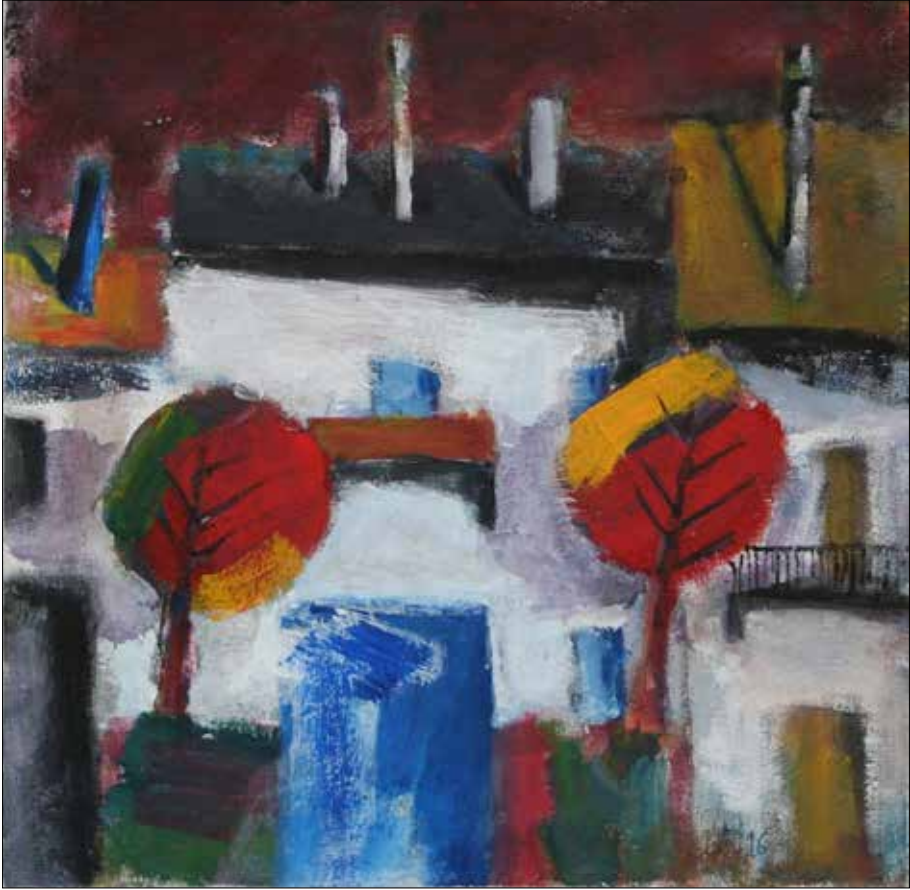
Aldea en outono. 2016. Acrílico. 60x60 cm.

a escultura é “construída” pero si cando é “escavada”. Véndome coa peza non se resiste a contar algo do seu pensar sobre este oficio, rematando cunha máxima compartida do gran Buonarroti.