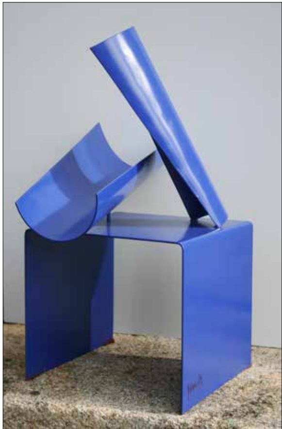
Intervención. 2015. Ferro negro e esmalte. 58,00x33,00x44,00 cm.

De súpeto acórdase das madalenas de Fita e non re-