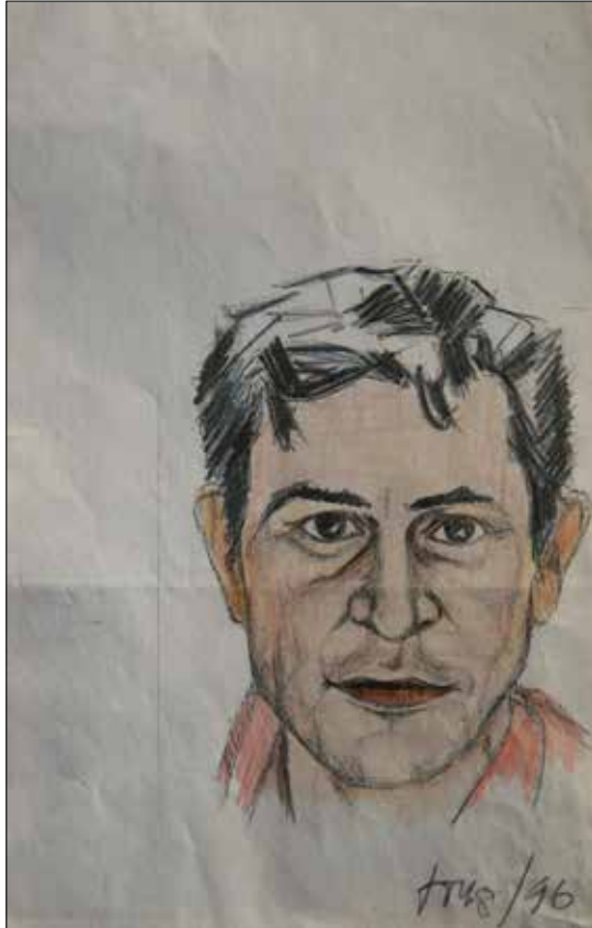
Autorretrato. 1996. Lapis a cor sobre papel. 25,00x16,00 cm.

É membro da Xunta de Goberno do Instituto de Estudos Miñoráns dende o ano 2002 e compoñente da sección de Arte da citada asociación segundo quedou dito.