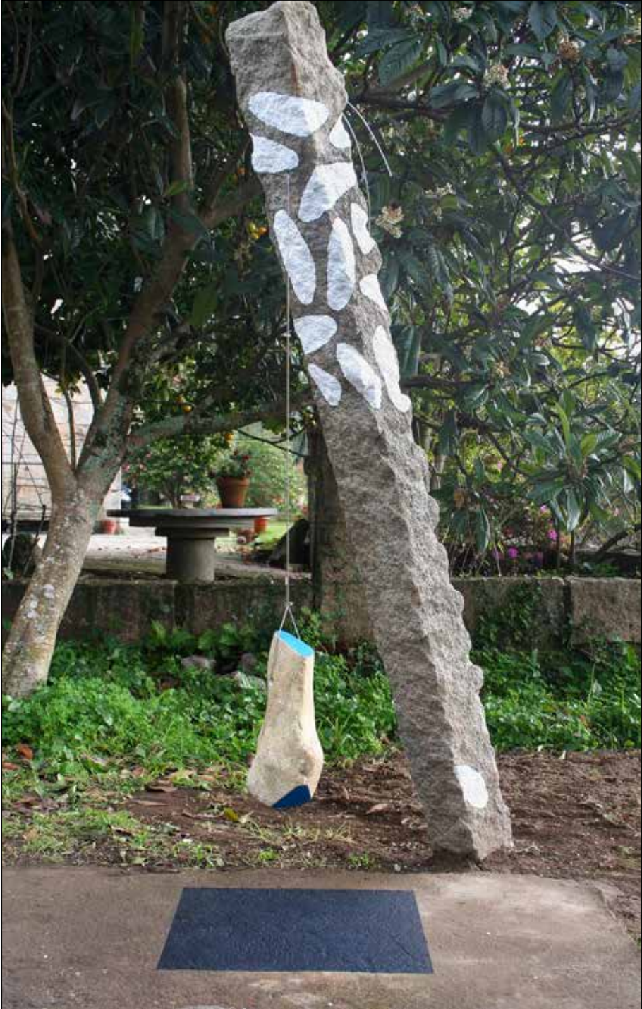
G. 9,8 nun espazo negro. 2018. Granito, aceiro, pigmento, formigón. 218,00x150,00x86,00 cm.