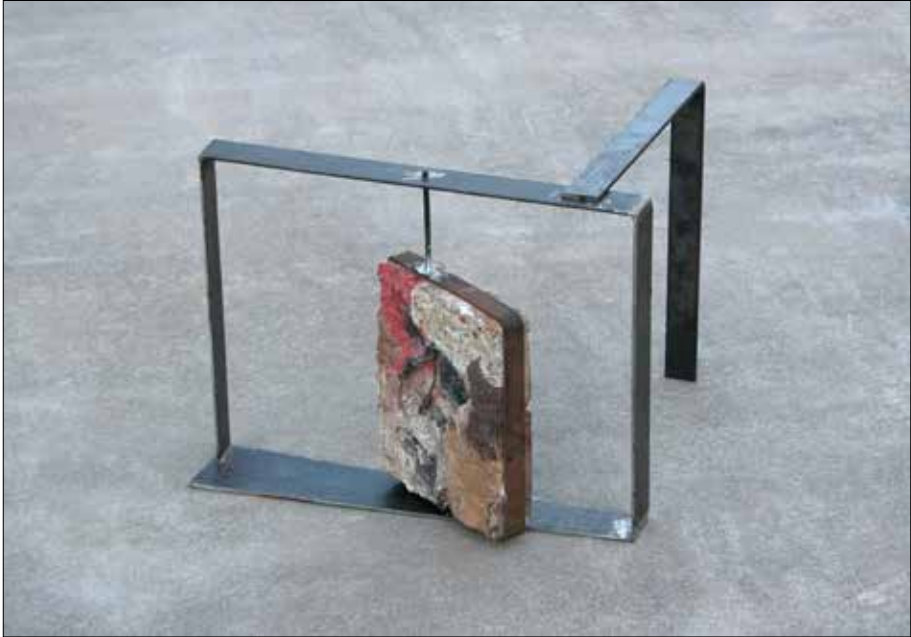
A cor do vento. 2015. Ferro negro e formigón coloreado. 39,50x53,50x51,50 cm.