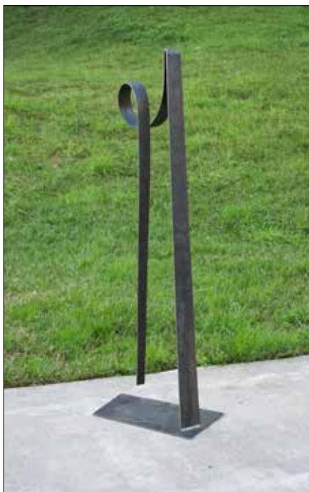
Levedade do número áureo. 2015. Aceiro corten 117,50x41,00x25,00 cm.