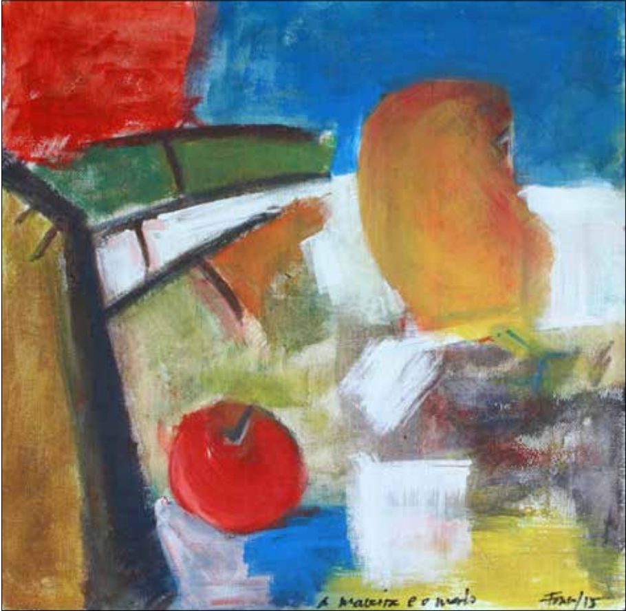
A maceira e o merlo -II-. 2015. Acrílico. 60x60 cm.

orixinal senón nunha copia. Paréceme lícito, máis, diría que necesario, utilizar os avances tecnolóxicos que a ciencia pon a disposición da sociedade. O mundo da arte debe estar moi atento a estas cuestións. Manipularei unha fotocopia e así, a través da intervención, tomará vida propia; volverá a converterse nun orixinal.