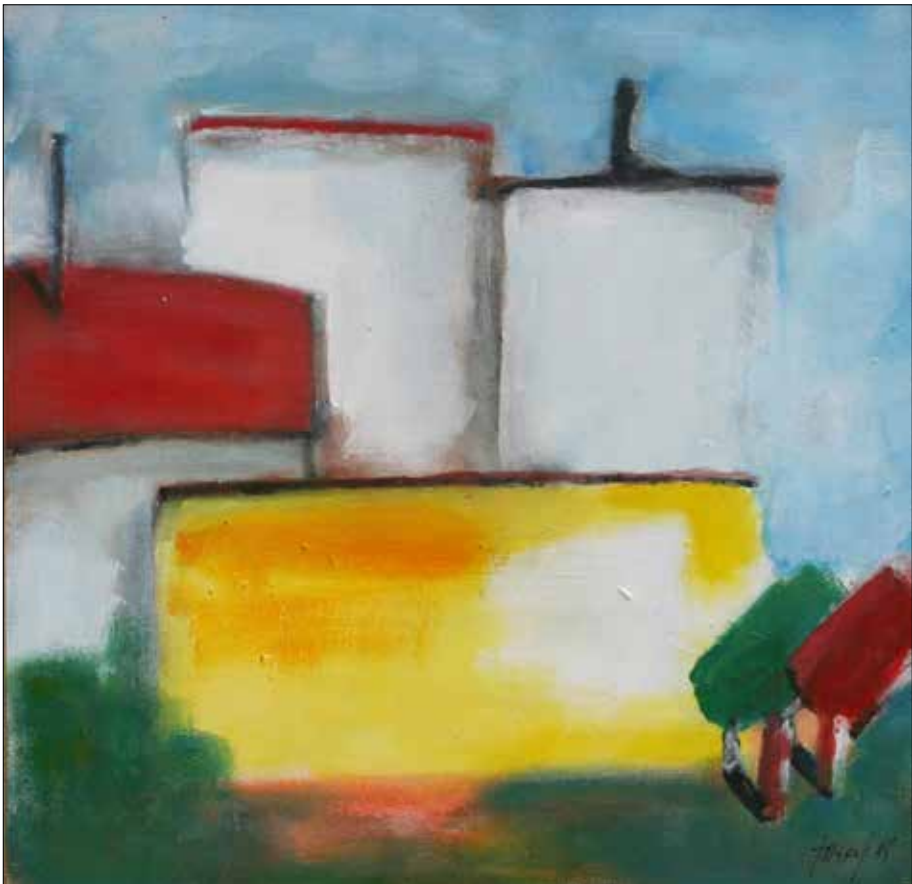
Amarelo sobre branco. 2018. Acrílico. 60x60 cm.

Sección de arte do IEM, 9 de decembro de 2018.