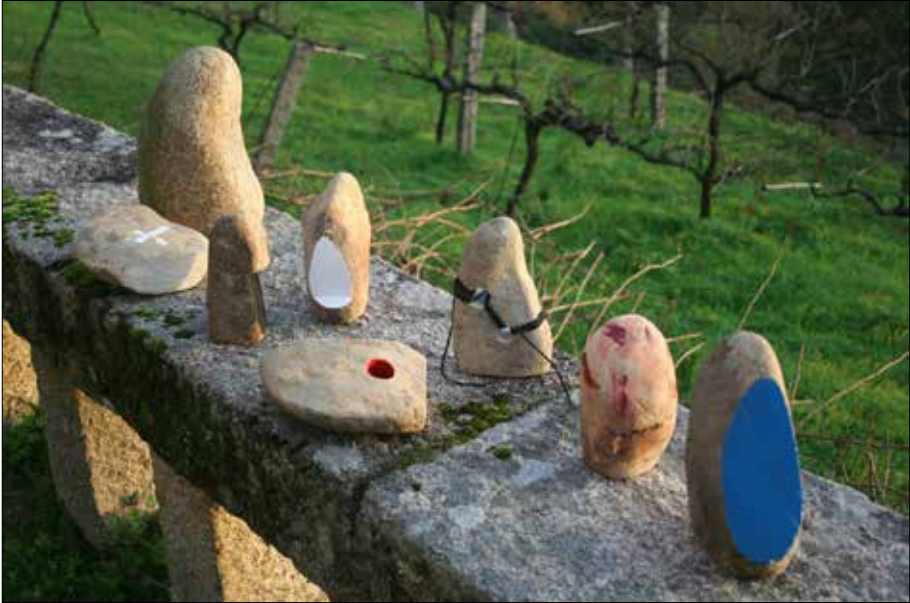
Algunhas pezas da serie Seixos. 2018. Granito, coiro e pintura.