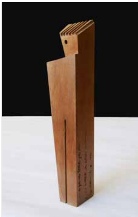
O home de pelo rizo tentado polo sono. 2010. Madeira. 29,80x5,60x5,00 cm.

Provisto dunhas tesoiras, sen luvas, e poñendo a máxima atención para non se tropezar cunha das moitas pugas con que a rubideira ameaza, vai podándolle os crecementos incontrolados. Non está disposto nin vai permitir que lle roube o pracer de contemplar a presenza dos humildes xeranos, os cales, floridos en vermello e en branco, poboan de cor e tradición campesiña os barrentos testos do referido corredor exterior. Mentres o fai, espero e observo. E en tanto estou aí, ergueito, Drogo, o gardián ocasional dos máis de catorce mil metros cadrados de predio, con certa axitación pola miña presenza, non para de ir e vir sen rumbo aparente mentres de vez en cando emite un ladrido. Así estivo un bo anaco e, acaso pola insistencia, nunha desas case tropeza, polo menos así quíxomo parecer, cos “Parrulos”. Agora, tombado aos meus pés, non