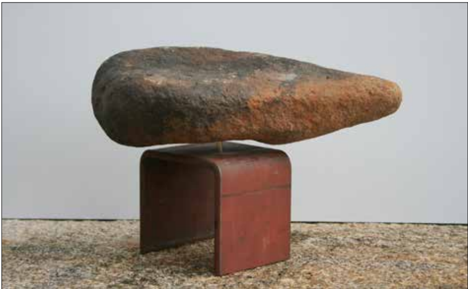
Evocación megalítica. 2018. Aceiro, aceiro inox. e granito. 21,00x30,00x13,50 cm.