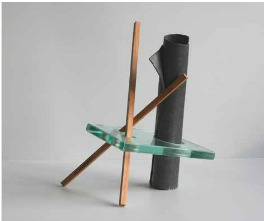
Roce. 2018. Vidro, madeira e chumbo. 28,50x21,00x19,00 cm.

prime o desexo. Ao pouco de entrar no comedor sae cunha en cada man e convidame. Fita prepáraas e enforna por ducias pero os acredores do doce alimento que comparten a casa son insaciables. Decide non seguir pintando hoxe. Quedamos sentados en silencio sobre un banco de pedra coa Serra da Groba como horizonte. Ao cabo dun tempo deixamos de suar. Máis tarde voume.