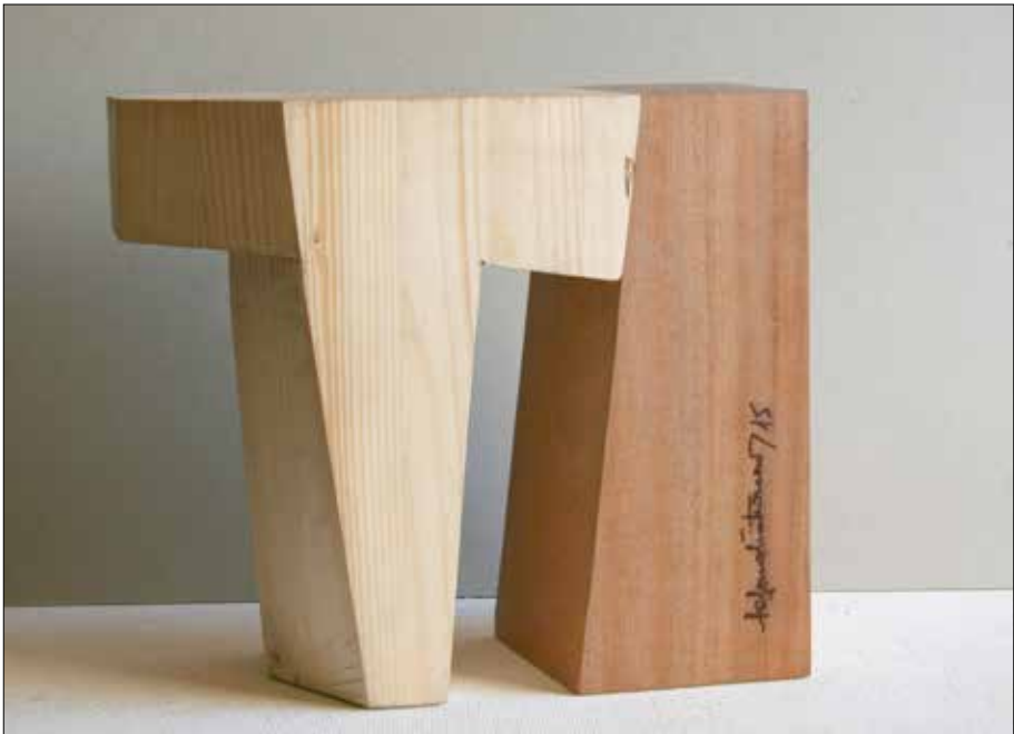
Talaiot. 2015. Madeira de abeto e sapeli. 26,00x30,00x12,00 cm.

-As camelias e as “lagerstroemia índica” son proposta miña pero os ligustros non. Parécenme demasiado grandes, cunha copa de moito volume para o espazo existente ata as casas e, por se fosen poucas razóns, levantan o pavimento. No proxecto tampouco con-