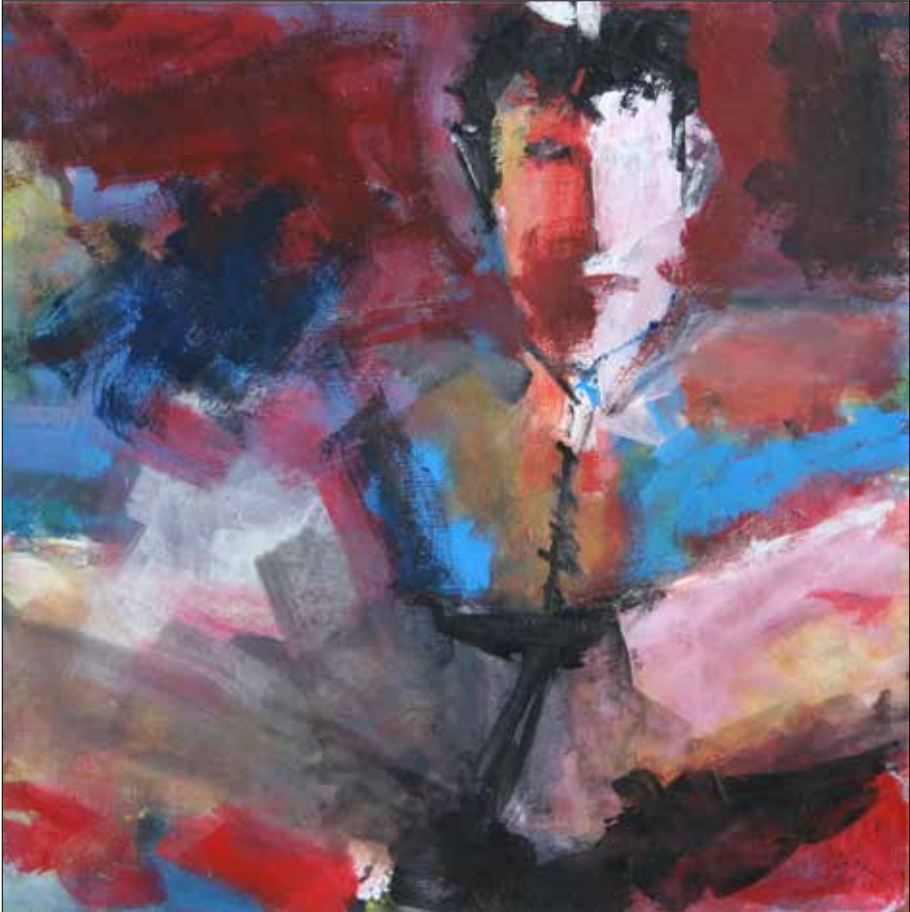
eufuno. 2017. Acrílico. 60x60 cm.

Recordo a actividade frenética que tiven ocasión de comprobar nunha visita feita neste mesmo mes hai agora un ano. Aquel día faloume do seu interese polo que chamaba en pintura a “técnica do inacabado” e contou que andaba angustiado porque se embarcara nunha empresa á cal non lle vía remate en prazo. En previsión, levaba traballando a ritmo toda a segunda parte do ano pero agora os dous últimos meses estánlle resultando particularmente esgotadores pola cantidade de horas que necesitaba pasar de pé. Quería sacar os retratos e unha serie de pezas abstractas que estaba a executar en paralelo a tempo para a celebración do solsticio de inverno, para as festas de Nadal. Rematou lográndoo, quizais precisamente polo prazo; de non existir posiblemente seguise dándolle algunha que outra volta a segundo cal obra. A maioría