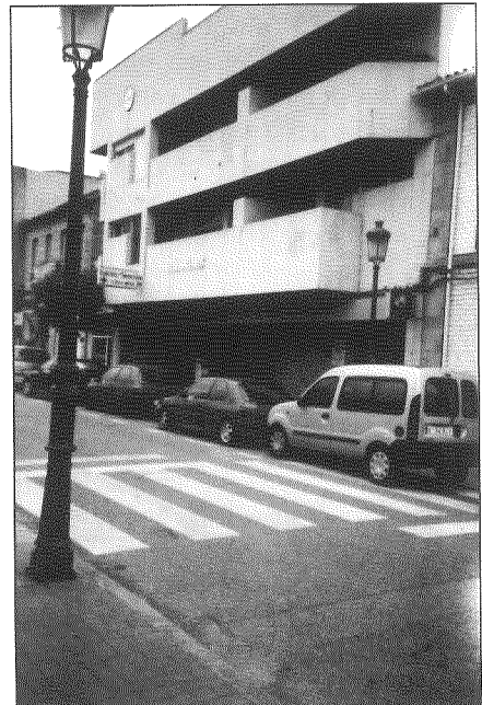
Aspecto na actualidade da zona onde se ubicaba a antiga estación

Pola tarde os protagonistas do domingo eran outros. As rúas baleirábanse e enchíanse os cinemas. Os dous que había na Vila, con presuntuosos e sonoros nomes, o Imperial e o Rialto, que domingo tras domingo, sempre, agasallaban ao respectable cunha