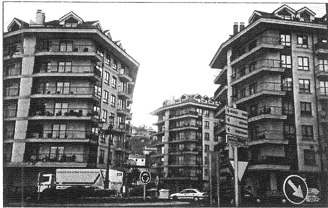
... cunha proliferación de edificios destinados a vivenda nos que a case totalidade dos mesmos permanecen baleiros durante todo o ano agás no período estival.

dade dos mesmos permanecen baleiros durante todo o ano agás no período estival. Por outra parte, existe o barrio da Anunciada, que foi creado entre os anos 1952 e 1956 e que alberga un alto número de familias mariñeiras. Nos arrabaldes predominan vivendas de planta baixa, espalladas de maneira aleatoria, vivendas de agricultores convivindo coas residencias secundarias, que se estenden polas áreas rurais do concello.