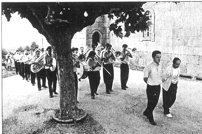
A Banda de Música da Agrupación Musical de Vincios en Santa Mariña (17/07/1994).

No ano 1984 os músicos decidiron mercar unha imaxe de Santa Cecilia e doarlla á igrexa de Vincios. Dende aquela todos os anos celébrase unha festa na data da patroa da música: con misa, procesión, concerto e banquete de celebración. Á mesma asisten os músicos que van deixando unha parte das súas ganancias, nomeadamente das actuacións do verán, para facer fronte a este gasto. Antes de ter esta celebración oficial xa se facían algunhas festas ás que acudían os músicos... e algún pai, para vixiar a rapazada. Como eles dicían, non vaia ser que cometan algunha equivocación. Xa se poden imaxinar que aos mozos e mozas esta vixilancia non lles facía moita gracia, pero sempre lograban esquivala e conseguían facer das súas.