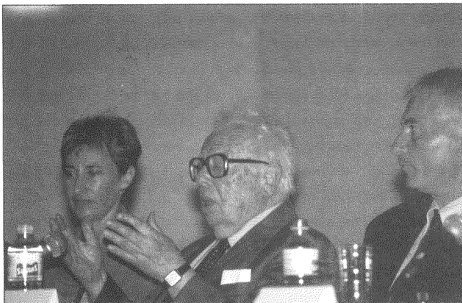
Intervención do Presidente da Real Academia Galega D. Francisco Fernández del Riego

No final do "Fausto" de Goethe, cando despois de buscar a felicidade nas mulleres, nas glorias militares, na ciencia....ten que optar entre atopar a felicidade nas mulleres ou atopar a felicidade nun acto que consiste en desecar un pantano para facer felices ás persoas que