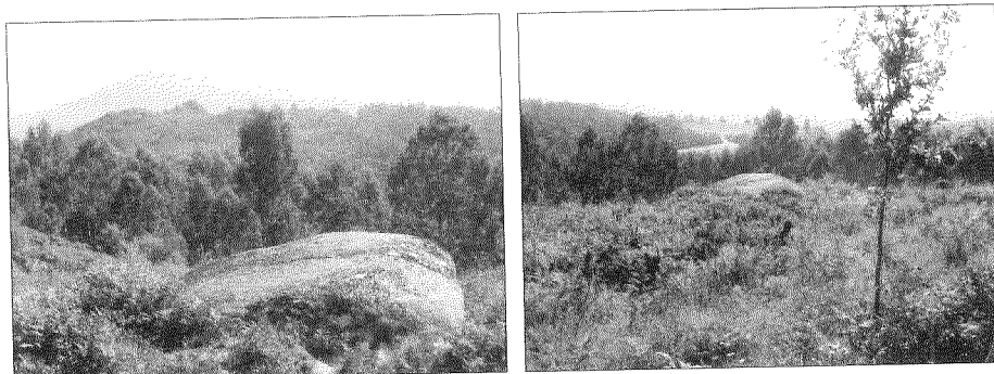
O Penedo Redondo, ao lado do camiño de Casa de Couso a Vincios e Valadares