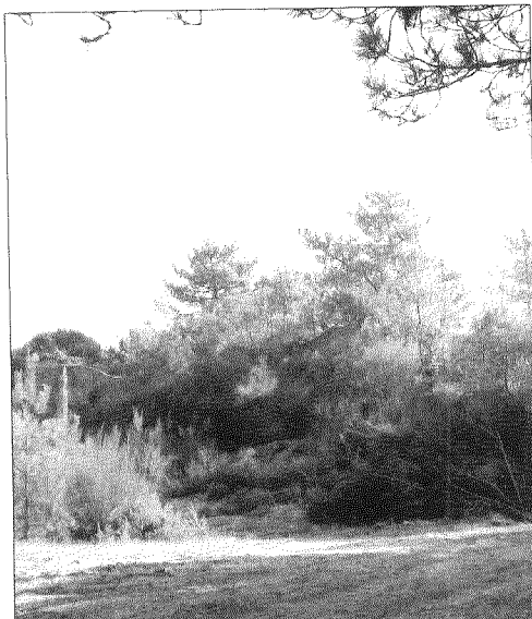
Outeiro do Ganador (situado detrás do Colexio Estudio)

Hai moitos anos, as parroquias de Chandebrito e Camos non se levaban ben, porque todos querían ter para a súa parroquia o Sanomedio (da capela sita na actual extrema das dúas). Para acabar con tan noxento andar fixeron un trato: os veciños de cada parroquia íanse xuntar cada un en diante da súa Igrexa e saírían correndo polo monte arriba; quen chegase o primeiro, para el era a capela do santo. Gañou Chandebrito e hoxe o santo está na súa Igrexa.