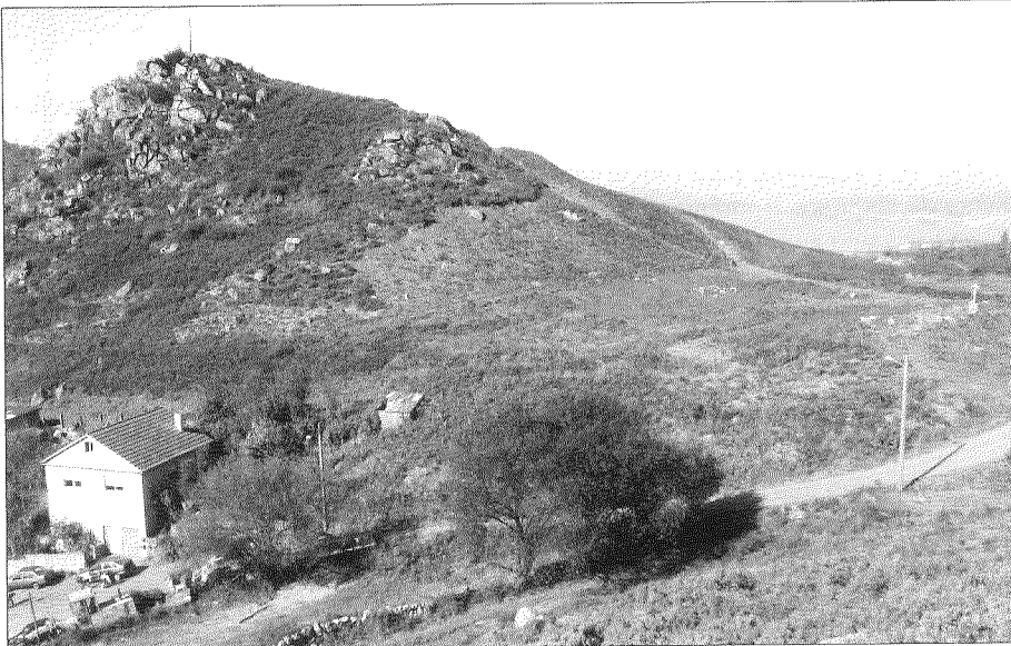
Abaixo, camiño da igrexa aos cruceiros, no Valiño. No centro á dereita, os cruceiros, baixo o Castro.

Santo pola tarde; tocaban as campás ao mediodía (a partir de aí dicían que era día santo) e despois durante eses tres días non tocaban máis, ata o sábado, que dicían “apreceu a Aleluia”. A imaxe que subían aos cruceiros era o Xesucristo e tamén á Virxe do Rosario.