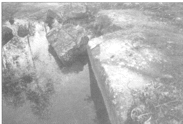
Deterioro por cantería.