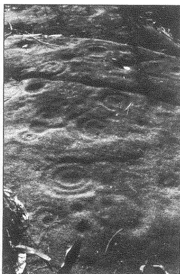
Os Campos. (Baíña - Baiona).

Todo isto contrasta co estado de conservación das superficies nas que se atopan os nosos gravados rupestres e o seu contorno, podendo afirmar que na actualidade non existe ningunha estación de arte rupestre, na nosa área, que cumpra as mínimas condicións para unha visita e contemplación adecuadas. A pesar de que contamos con superficies coma a da Auga da Laxe na serra do Galiñeiro, que é a máis espectacular de Europa con representacións de armas; os círculos de maiores dimensións do continente no Monte Tetón (Tomiño); o único panel con representación de embarcación no Noroeste da península en Pedornes (Oia); o labirinto de maiores dimensións en Burgueira (Oia); o único gran panel de cuadrúpedes do Noroeste en Os Campos (Baiona) etc., etc.