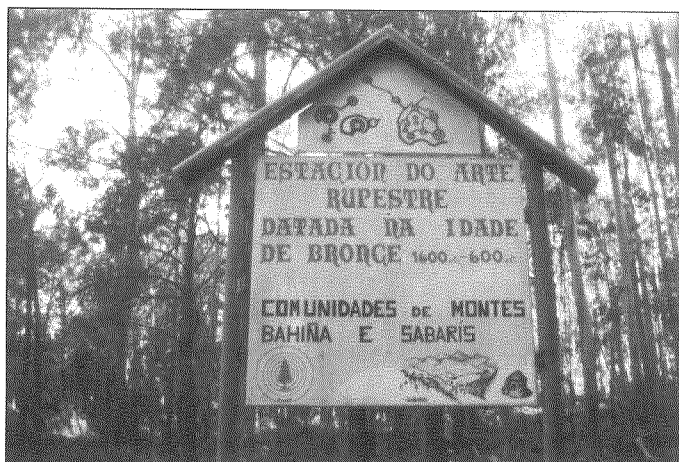
Boa vontade, mais datación imprecisa.

2.- A publicación dos gravados da zona en repetidas ocasións, que contribuíu á popularización do lugar.