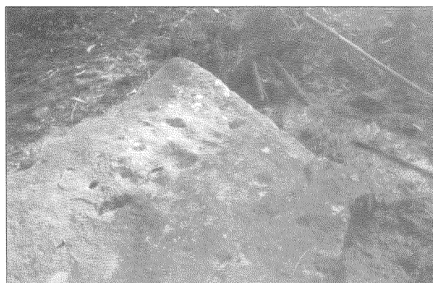
Destrozos por cantería.

colocación dalgún panel indicando o lugar. A ausencia de mantemento sostido orixinou a desaparición parcial do valado e da sinalización, e o estado de abandono é evidente, coa vexetación "afogando" literalmente a superficie ante a impasibilidade das institucións.