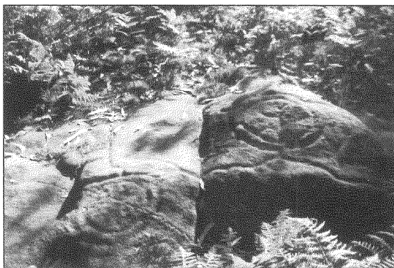
Os Campos. (Sta. Cristina - Baiona).

Resulta evidente que nos últimos anos se ten incrementado notablemente a curiosidade polos petroglifos galegos. Boa proba diso é a profusión de motivos do seu repertorio iconográfico que se reproducen en logotipos de empresas, bancos, asociacións, etc., mesmo dando imaxe a proxectos da administración pública como foi o caso de "Galicia Cidade Única". Repertorio que ten pasado tamén a formar parte de forma maioritaria do mercado da artesanía para o agasallo e "souvenir" (cerámica, xoiería, bixutería, camisetas ...), con reproducións copiadas das publicacións dedicadas á manifestación plástica máis espectacular da nosa prehistoria.