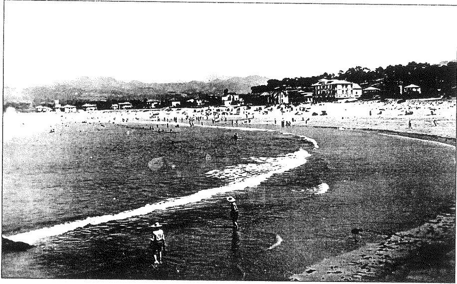
Ás cinco da tarde en punto, segundo a traxectoria solar, e coa dixestión feita dun escaso xantar, tocaba a hora do baño.

nais coas sabas despregadas como as velas dun bergantín. Pero non eran as únicas, nin era a primeira vez. O rebumbio dos mozos de Panxón, que levaban horas ao asexo, podía máis có rumusmús do mar e sementaban de novo o desconcerto naquelas mulleres que non sabían que facer coas sabas, nin a quen atender. Unha estratexia tan vella coma efectiva que funcionaba á perfección, e mentres, alleas a aquel balbordo, ían saíndo do mar as rapazas de Morgadáns coma unhas Venus de Botticelli, totalmente expostas e curadas de prexuízos.