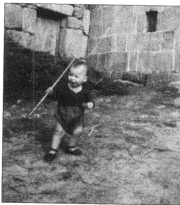
Santiago botando a andar