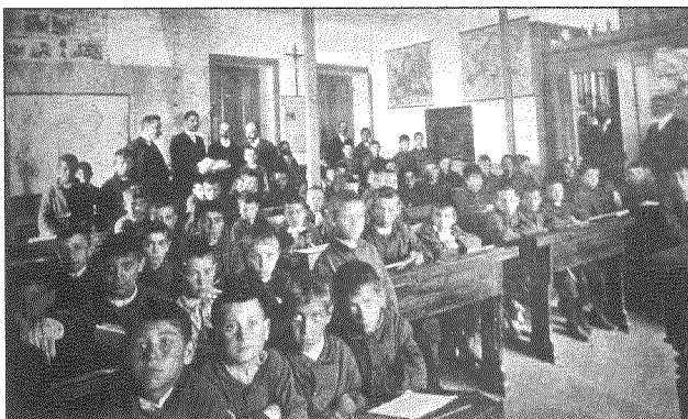
Grupo de alumnos e profesores das Escolas Pro-Val Miñor (Vida Gallega)