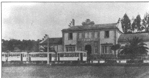
O exemplar edificio das Escolas Pro-Val Miñor inaugurado no curso académico 1914 -1915

Unha vez expostos os coñecementos básicos para preparar a estas xentes que buscaban traballo fóra das súas zonas de orixe, as Sociedades de Instrucción tamén se preocuparon de crear escolas e, como consecuencia, de elixir locais escolares en condicións idóneas. Nun principio, dadas as modestas condicións económicas nas que se atopaban, pensouse no alugamento dos inmobles, pero a medida que estas Sociedades foron incrementando a súa economía puideron deseñar e construír os seus propios edificios escolares, conseguindo obras grandiosas e dignas de gabanza, creadas por recoñecidos arquitectos, como é o caso da "Sociedad Unión Hispano Americana Valle Miñor". Desta forma erixíronse construcións que cumpriron as regras pedagóxicas e sanitarias de vangarda, emprazadas en terreos salubres e soleados, e elaboradas con materiais de primeira calidade. Nas "Escuelas Valle Miñor" ergucuse un edificio recuberto de elementos ornamentais que lle outorgaron un aspecto de grandiosidade, quizais pouco axeitado para o contorno de penuria socioeconómica peculiar do momento, pero interpretado tamén como un produto xurdido do esforzo e tesón dun colectivo de xentes preocupadas por superar tantas dificultades.