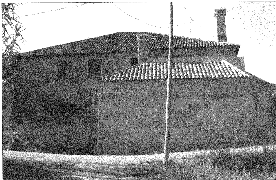
Casa de Balinfra. Santa Baia de Camos, Nigrán. Fachada lateral.