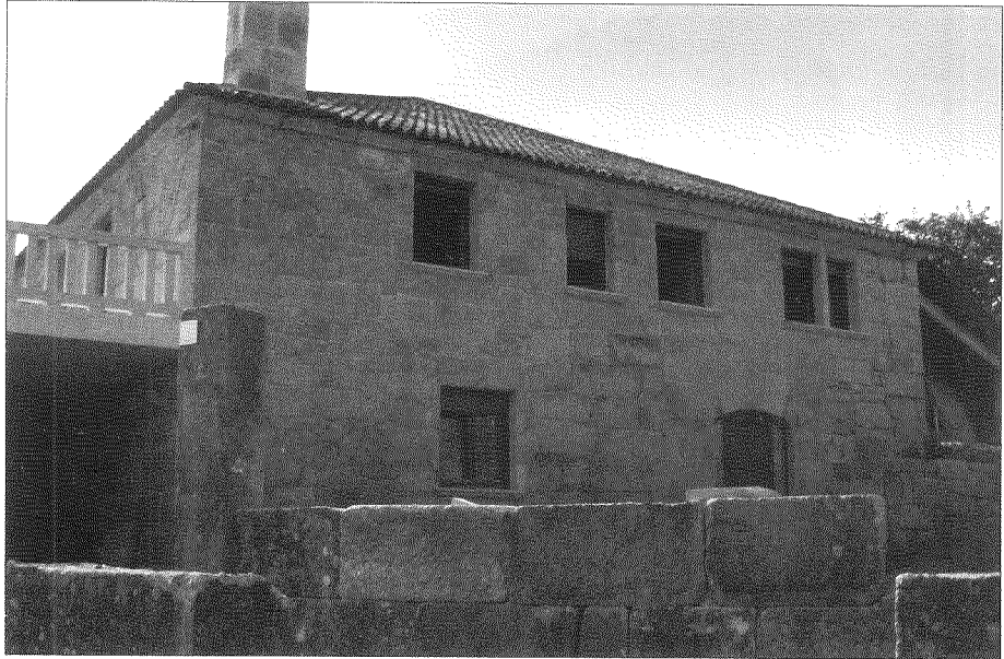
No 2008 a Casa de Balinfra tivo un profundo proceso de reformas.

dous esposos outorgaron testamento na súa casa de Balinfra o 15 de setembro de 1677.