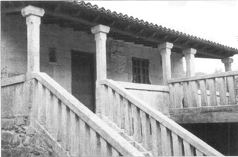
Vista do patio interior.