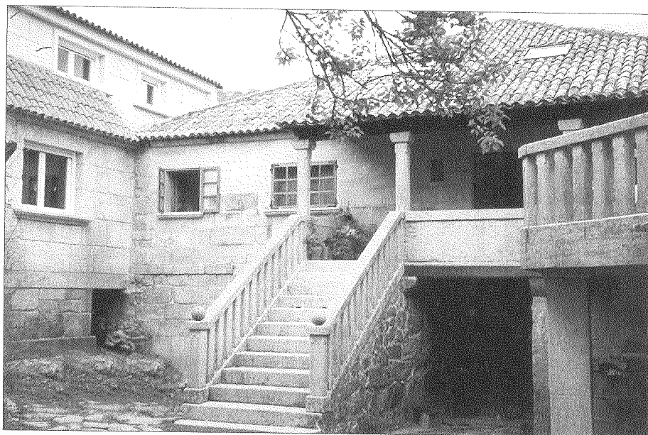
Casa de Balinfra. Santa Baia de Camos, Nigrán.

Neste interesante documento manifesta don Álvaro o seu desexo de ser sepultado na capela de Santa Catalina, no propio castelo de Viana, pasado un tempo ordena que os seus restos se depositen na súa capela de San Miguel, incluída no convento de San Francisco de Baiona. Dispón a continuación un legado de 1.200 misas pola súa alma, 700 nos conventos de Viana e 500 en San Francisco de Baiona. Libera don Álvaro a Antonio Negro, o seu escravo, e confía a Antonia, a súa escrava, á súa filla dona Beatriz. ?Ordena edificar, despois de pasar catro anos do seu óbito, unha capela baixo a advocación de San Miguel no seu lugar de Balinfra e funda, finalmente, unha mellora de terzo e quinto vincular cos seus bens .../... y que haya de ser y sea cabeza de este dicho patronato y morgado la mi capilla de San Miguel de Baiona y la que se hiciere dentro de la mi granja que está sita en la aldea de Balinfra con sus casas, viñas, guertas y campos a la dicha granja llegados ./ con la obligación para los sucesores de agregar el tercio y quinto de sus bienes libres al morgado familiar, y si ./ casare con señora de otra casa y morgado haya siempre el que sucediere de llamarse de mi apellido de Troncoso y Ulloas por ser como soy uno de tres señores directos de la casa de los Troncosos .../... 3