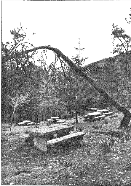
Débese compatibilizar os usos das tres funcións que todo o monte debe cumprir: a social, a económica e a ecolóxica.

Ten que haber unha actuación para que se desenvolvan todas as súas potencialidades (gando, produtos agrícolas, madeira, paisaxe, patrimonio histórico-artístico, aproveitamento da biomasa forestal, turismo rural e natural, sendeirismo...). Actuación para que estas potencialidades beneficien en primeiro lugar aos veciños e veciñas comuñeiros, e en segundo lugar á sociedade galega en xeral. Só que o desenvolvemento das potencialidades do monte, do monte veciñal en man común, cómpre facelo, como tentan de facer as cmvmc, baixo o concepto da sustentabilidade, e compatibilizando os usos das tres funcións que todo o monte debe cumprir: a social, a económica e a ecolóxica.