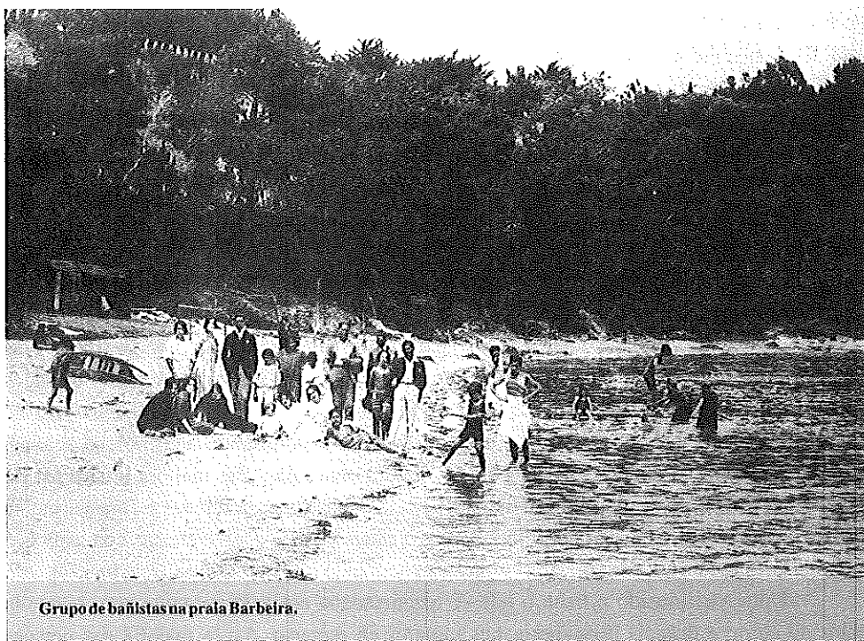
Grupo de bañistas na praia Barbelra.

que viñera a traballar aquí de xeito temporal. Así, temos constancia do funcionamento nestes anos de tres hoteis de certa consideración: Hotel La Palma , Hotel Roma e Hotel Madrid . Algúns deles investiron parte das súas ganancias en facer publicidade en importantes revistas do momento, pois presentaban que así aumentaría a demanda de clientes en próximas tempadas. A confortabilidade era a característica que os seus propietarios destacaban á hora de promocionalos seus negocios, aínda que nestes momentos tampouco se pode falar de grandes luxos no referente ás súas instalacións.