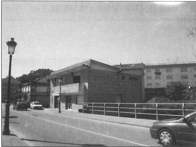
Cámara agraria. Gondomar.