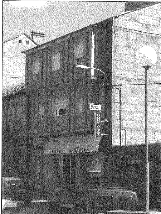
Edificio de vivendas con aplicación de pastas tradicionais. Gondomar.

A súa carreira iníciase no ano 1957, no momento de acabar a carreira, cunha obra madura e rotunda: o edificio de Marqués de Valladares, 27, se cadra a súa mellor obra. O edificio, que se artella compositivamente ao redor do tema do patio interior, presenta xa unhas características que serán relevantes no conxunto da súa carreira: o aproveitamento da luz e a potenciación dos elementos estruturais. Neste edificio "deixa a estrutura dos forxados vistos, subliñando a orde interna, sen inducir nada entre espacio e arquitectura". Estas palabras de Celestino García Braña aclaran algúns dos motivos que reiteradamente aparecerán na súa