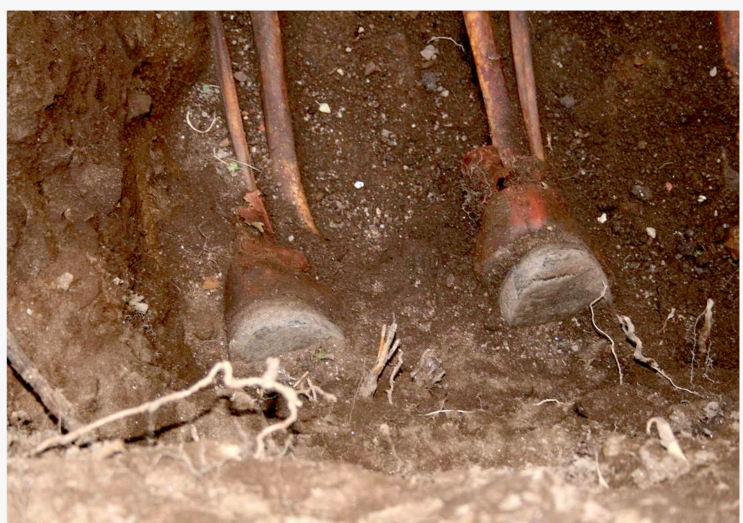
Detalle das botas en conexión con outros elementos esqueléticos.