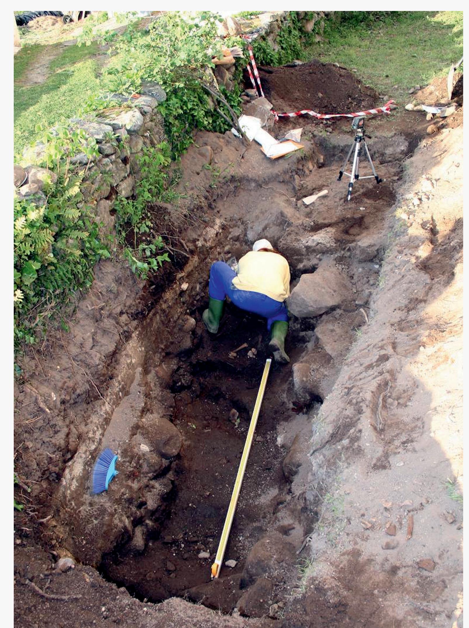
As primeiras sondaxes

O resultado foi negativo, se ben a partir dos 15/20 cm. aparecían ósos soltos, lóxico por atopármolos nun espazo de enterramento centenario, pero tamén entullo ata os 90 cm. de profundidade que interpretamos como botado alí despois de exhumar os corpos para trasladalos ao cemiterio novo en 1971.