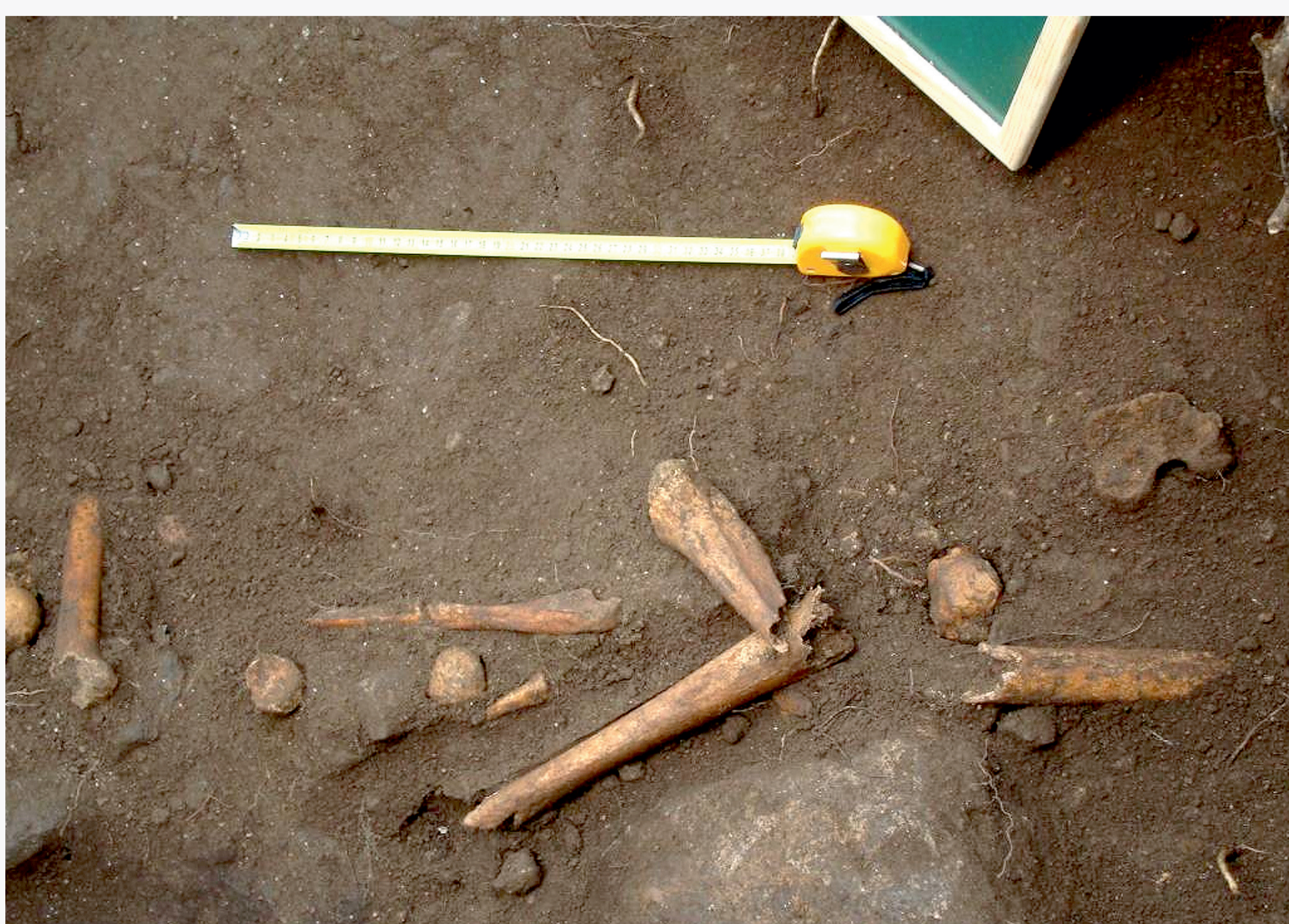
Exemplos de concentracións de ósos non relacionados cos asasinados.

O resultado foi negativo, se ben a partir dos 15/20 cm. aparecían ósos soltos, lóxico por atopármolos nun espazo de enterramento centenario, pero tamén entullo ata os 90 cm. de profundidade que interpretamos como botado alí despois de exhumar os corpos para trasladalos ao cemiterio novo en 1971.