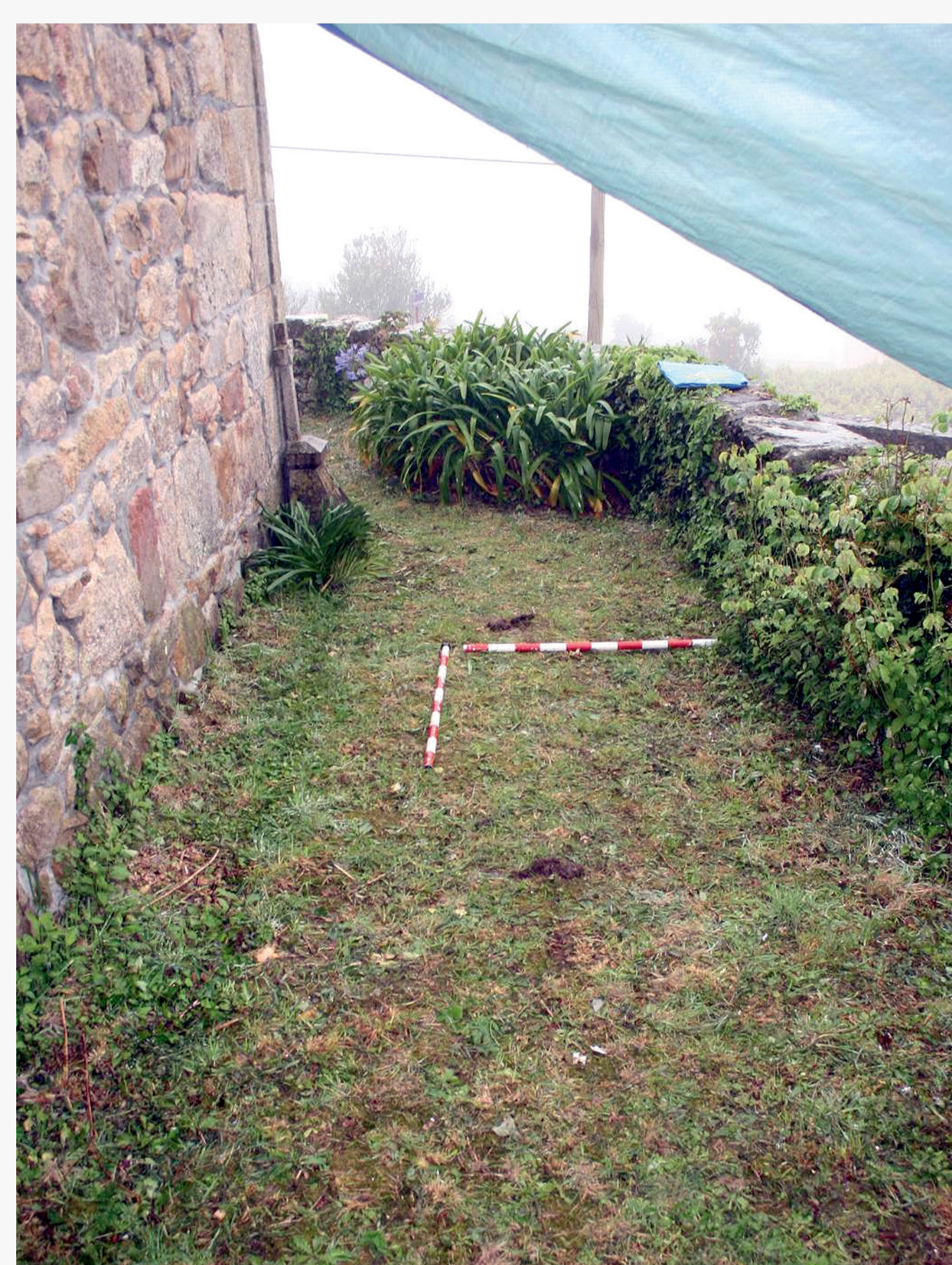
Aspecto do emprazamento da fosa previo ao inicio da escavación