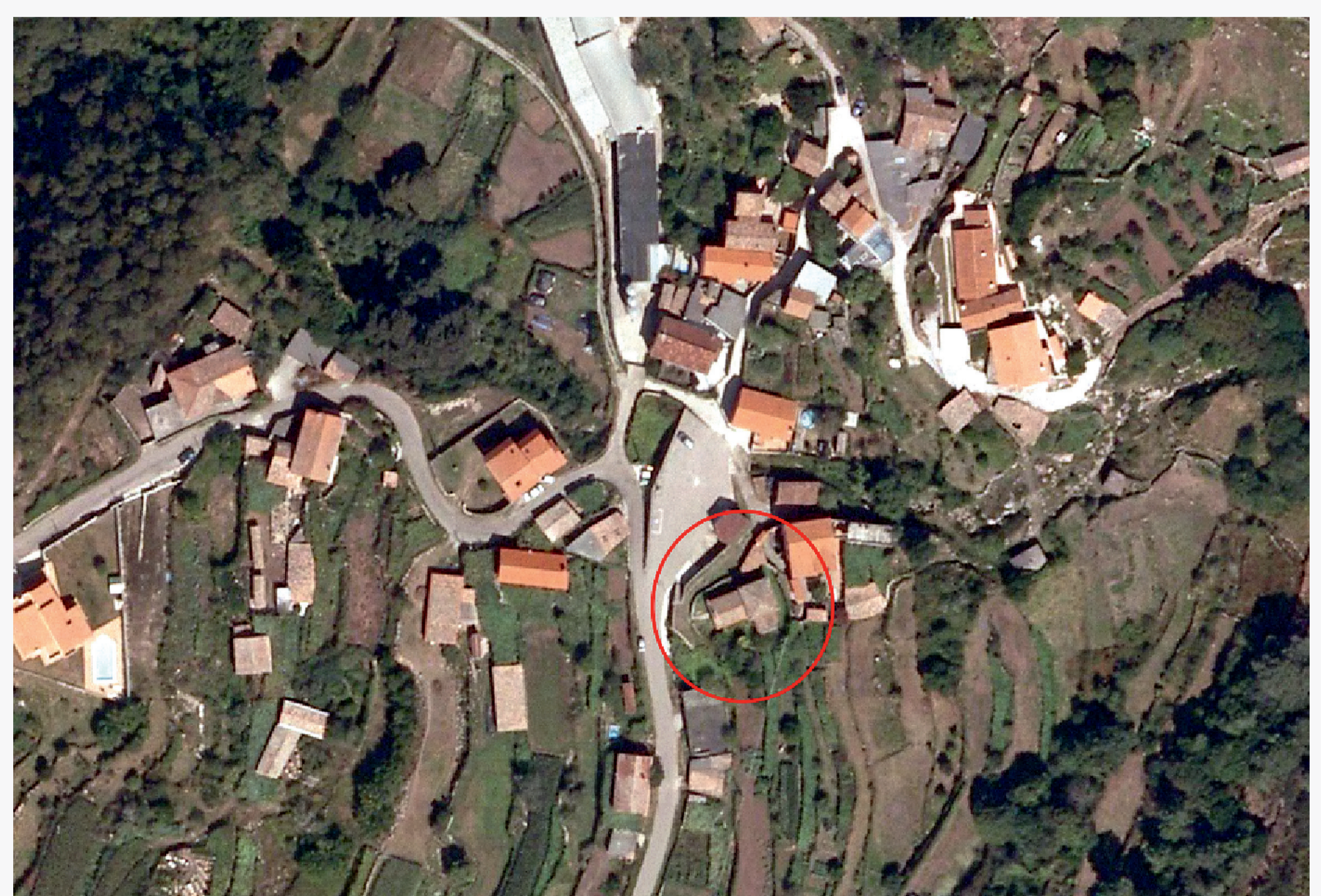
Fotografía aérea coa situación da igrexa no lugar de San Xián.