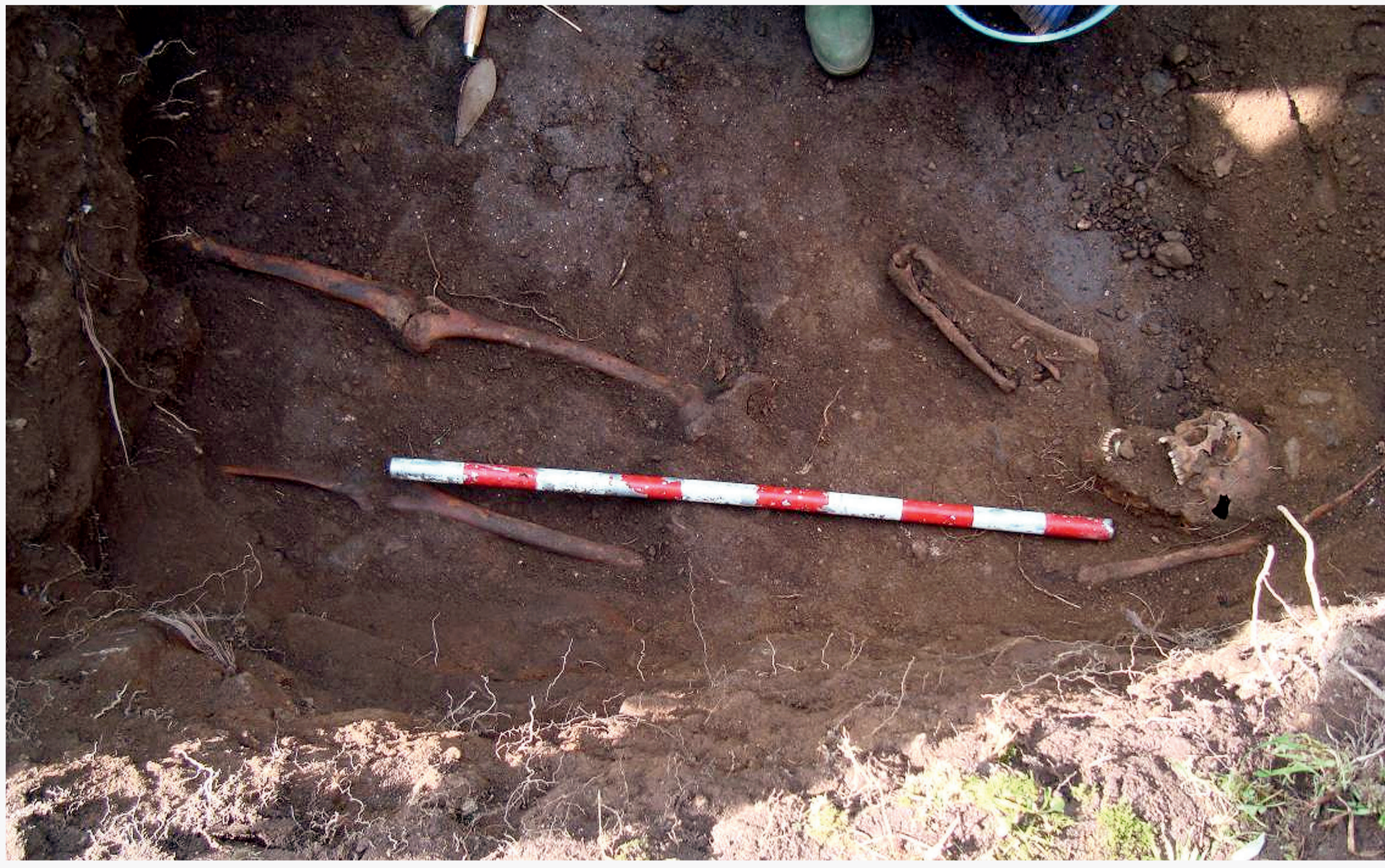
Individuo 3 parcialmente escavado