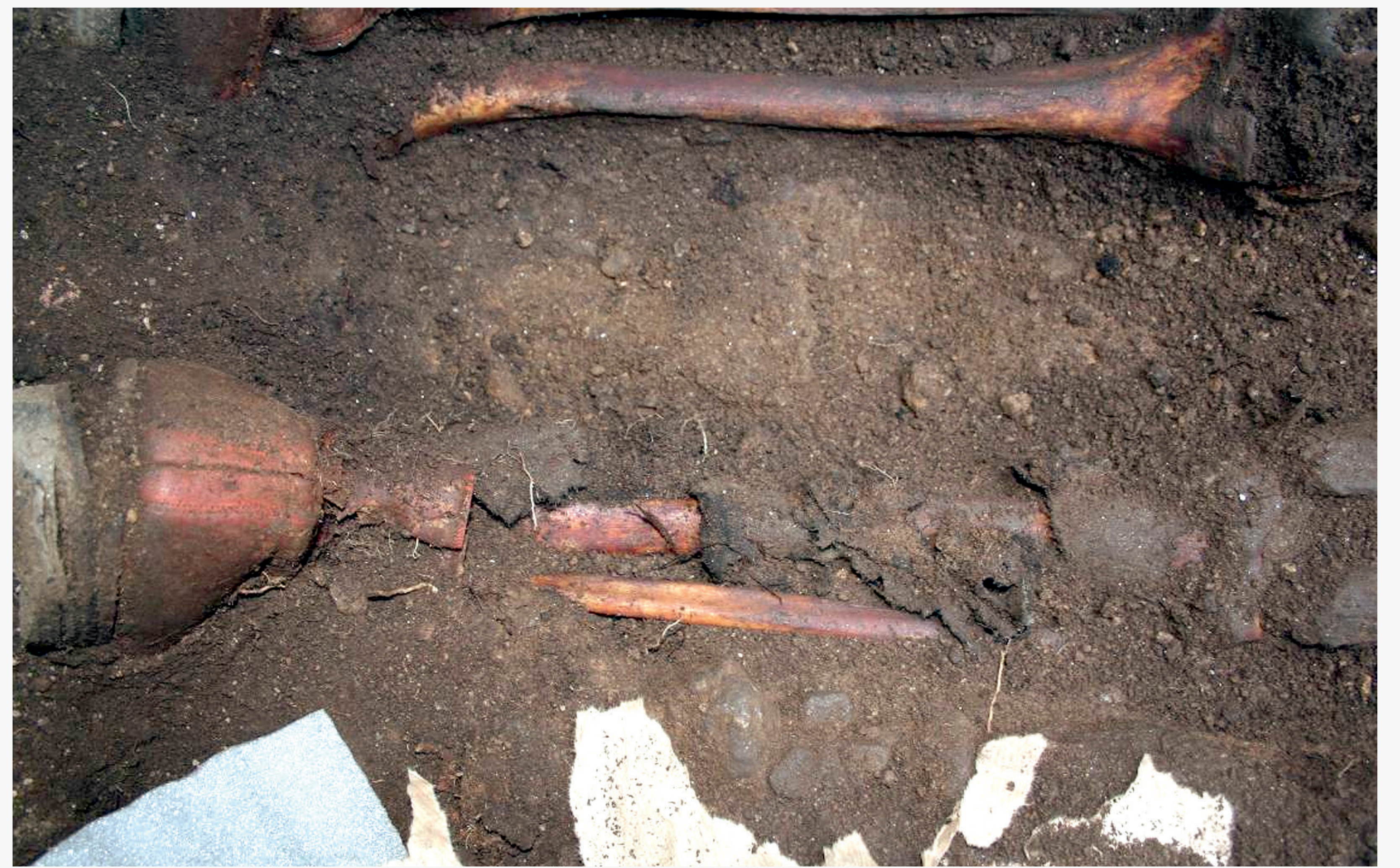
Detalle das botas e restos de tecido (pantalóns) conservados no Individuo 1.