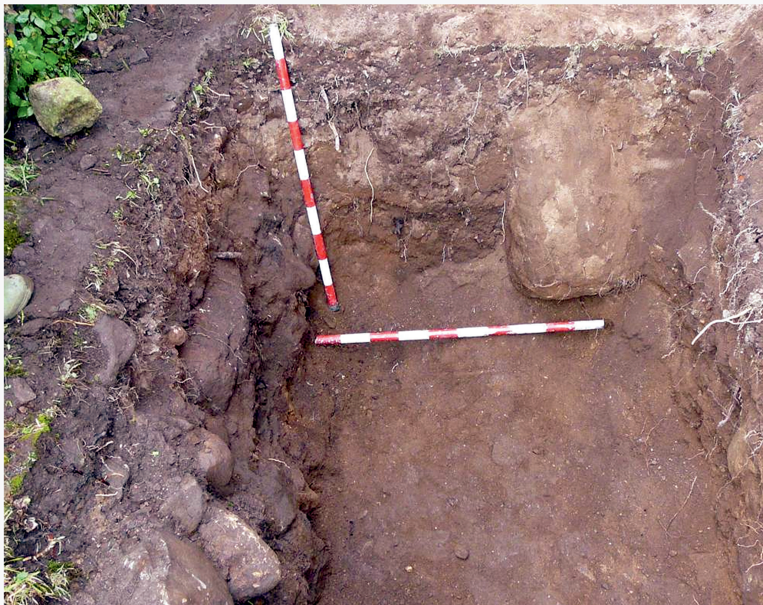
Aspecto da fosa unha vez exhumados os tres cadáveres.