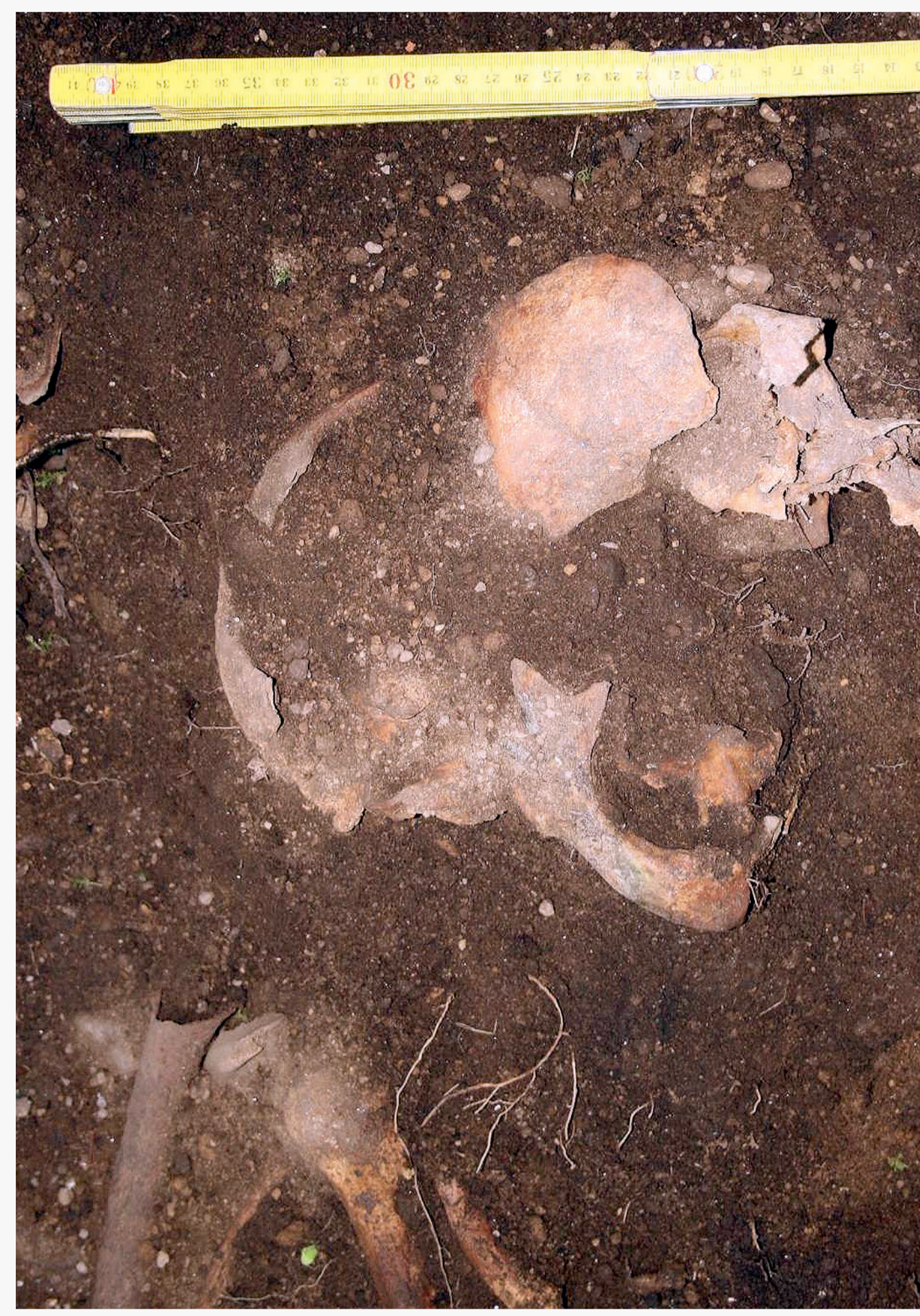
Aspecto do tramo superior do corpo e do cráneo do individuo 2.