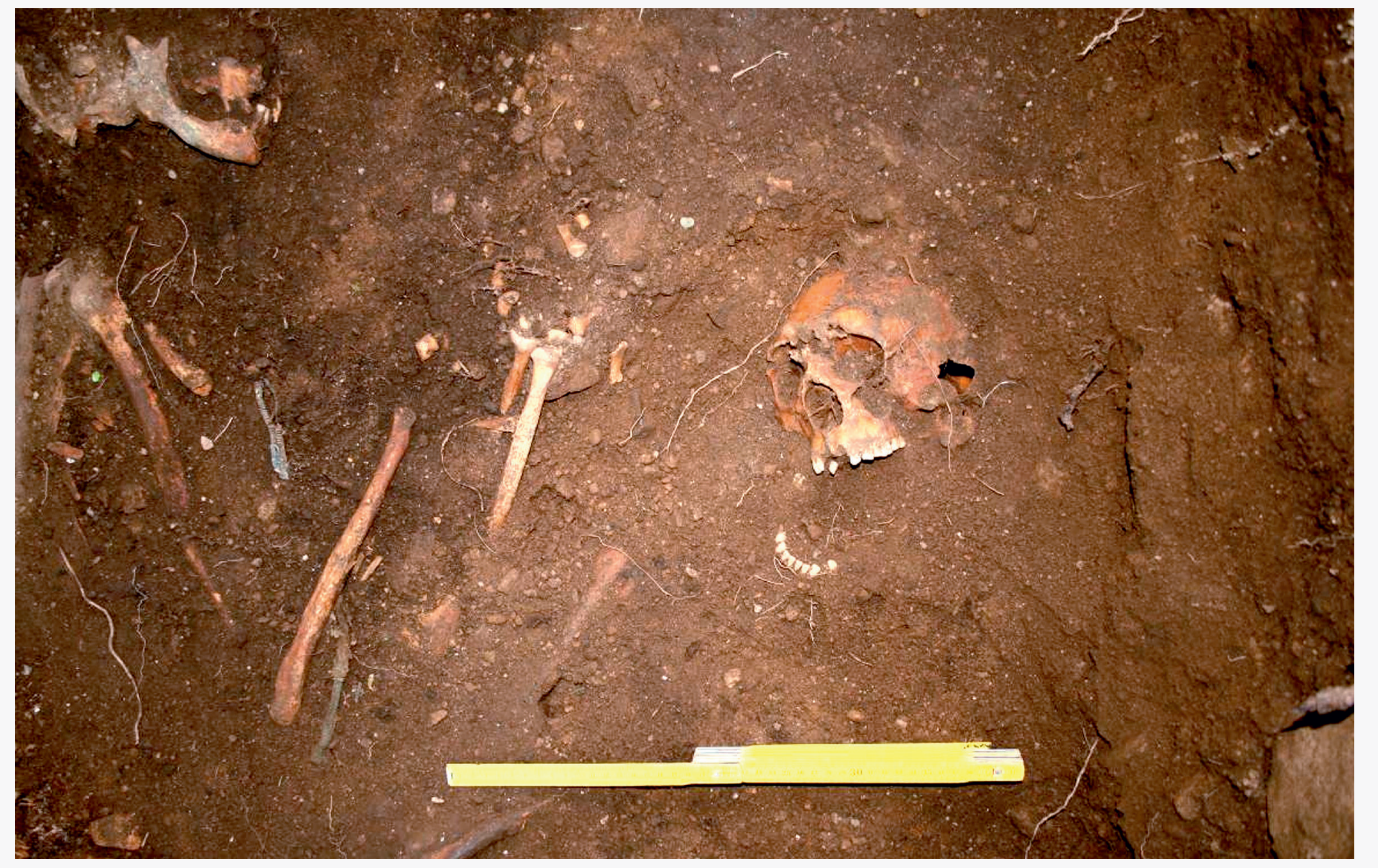
Detalle do cráneo e do brazo dereito do Individuo 3 en proceso de escavación.

A orde de deposición parece que se iniciou polo individuo 3, logo continuouse polo individuo 2 e rematouse co individuo 1 a vulgar polas superposicións anatómicas.