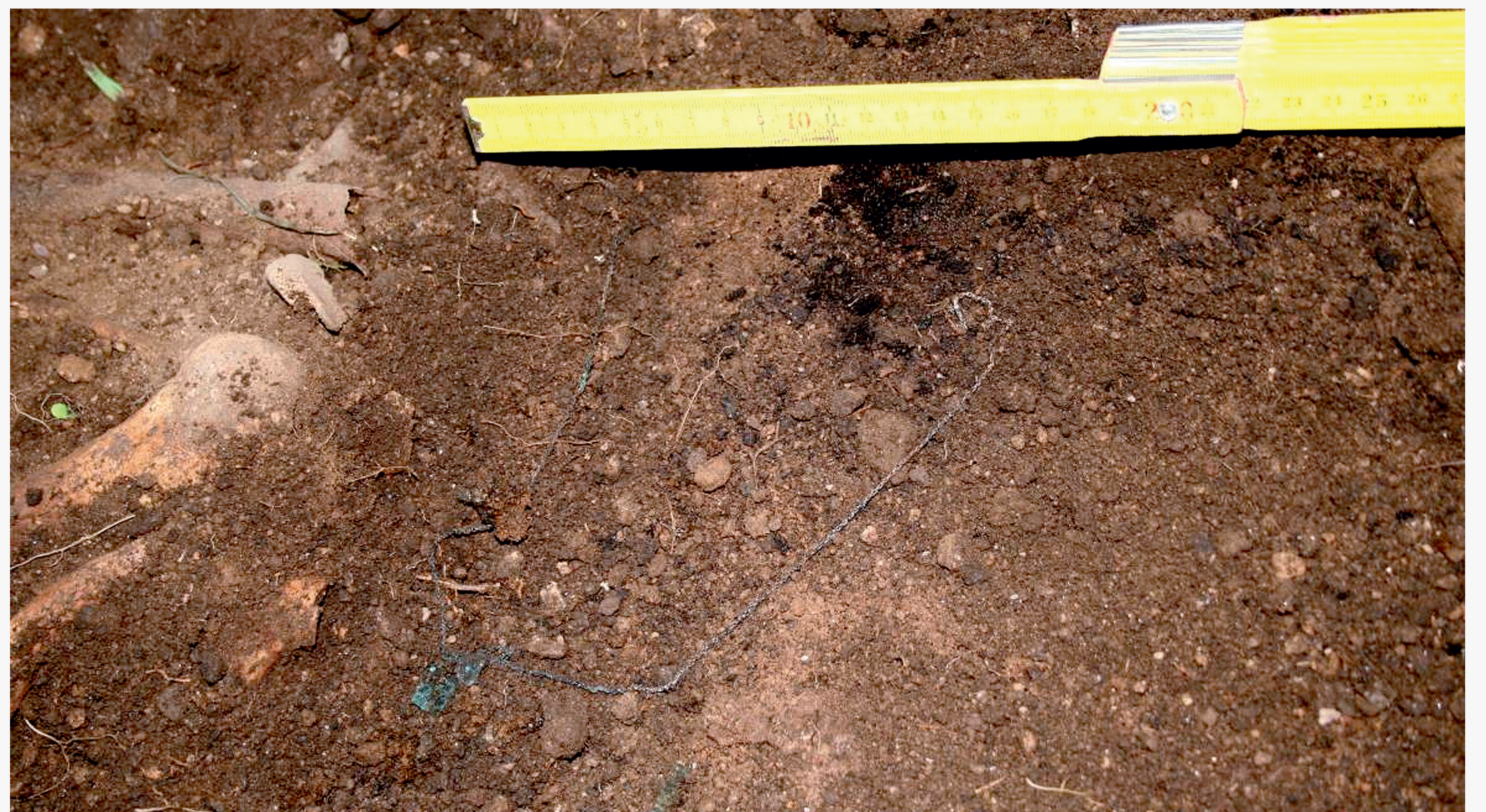
Detalle da cadea metálica que portaba o Individuo 2