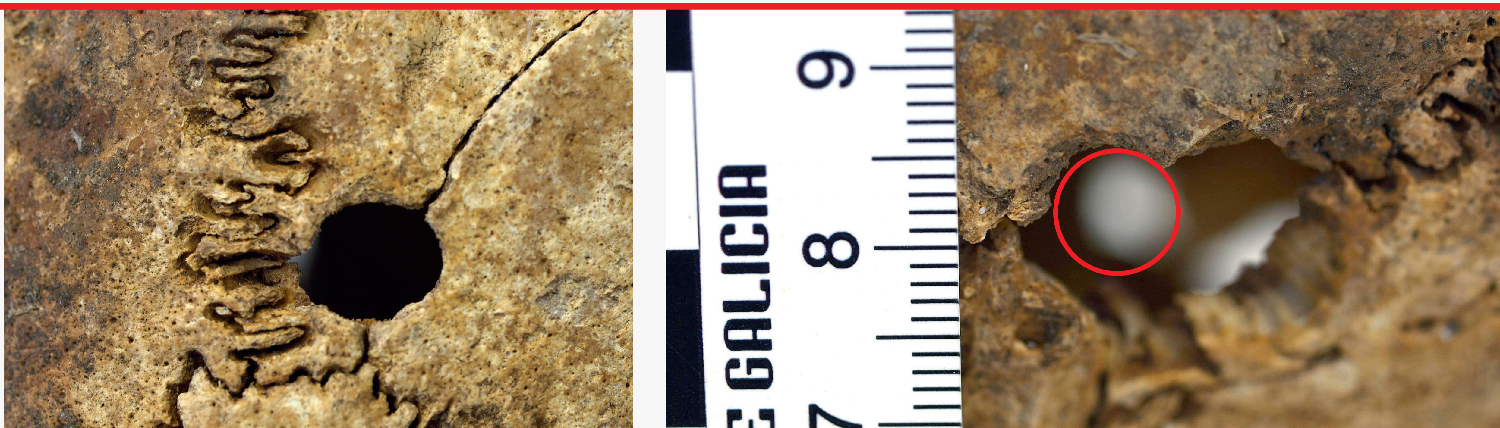
Orificio de entrada de proxectil duns 9 mm. en zona media da caluga.