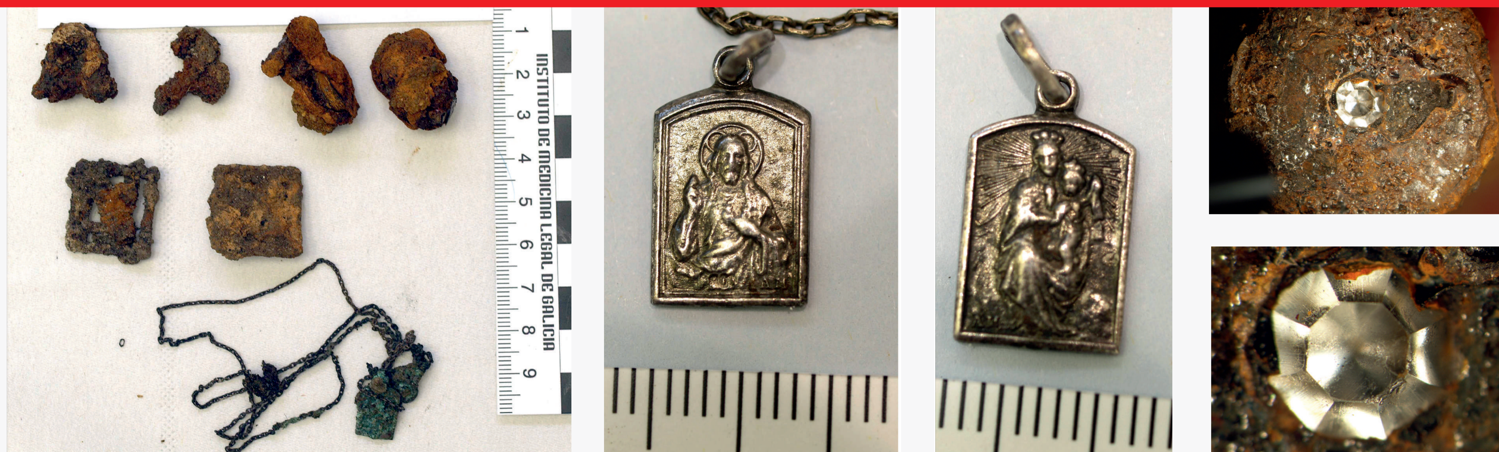
Alguns obxectos asociados á FOSA 1-INDIVIDUO 2 antes e despois da súa limpeza.