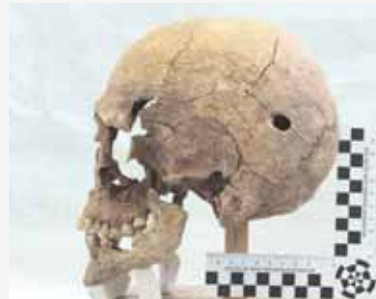
Orificio de entrada de proxectil de arma de fogo en parietal esquerdo