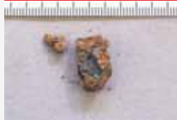
Proxectil atopado sobre a cara interna do parietal esquerdo