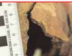
Orificio de saída de arma de fogo na rexión frontal esquerda