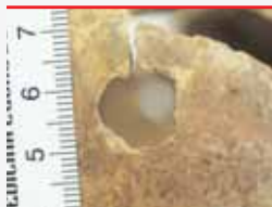
Orificio de entrada do proxectil de arma de fogo na zona dereita da caluga