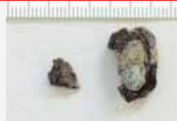
Proxectil atopado no cribado da terra do interior do cráneo