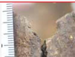
Orificio de entrada do proxectil de arma de fogo na zona central da caluga