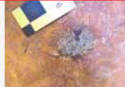
Depósito de sales de chumbo